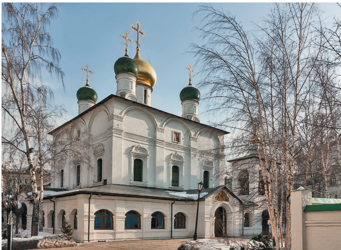
На месте Кучкова поля в XIV столетии в память избавления Москвы от нашествия Тамерлана был основан Сретенский монастырь

И сама Москва, и близлежащие селения, и прилегающие земли до Юрия Долгорукого принадлежали суздальскому боярину Степану Кучке (Кучко). До сих пор один из районов Москвы рядом с Лубянской площадью именуется Кучковым полем, хотя ни на одной