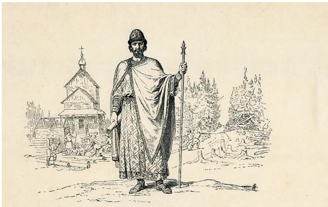
В. П. Верещагин. Юрий Долгорукий. Иллюстрация из альбома «История государства Российского в изображениях державных его правителей». 1896 г.

если в 1147 году Юрий Долгорукий уже приглашает туда своих соратников?