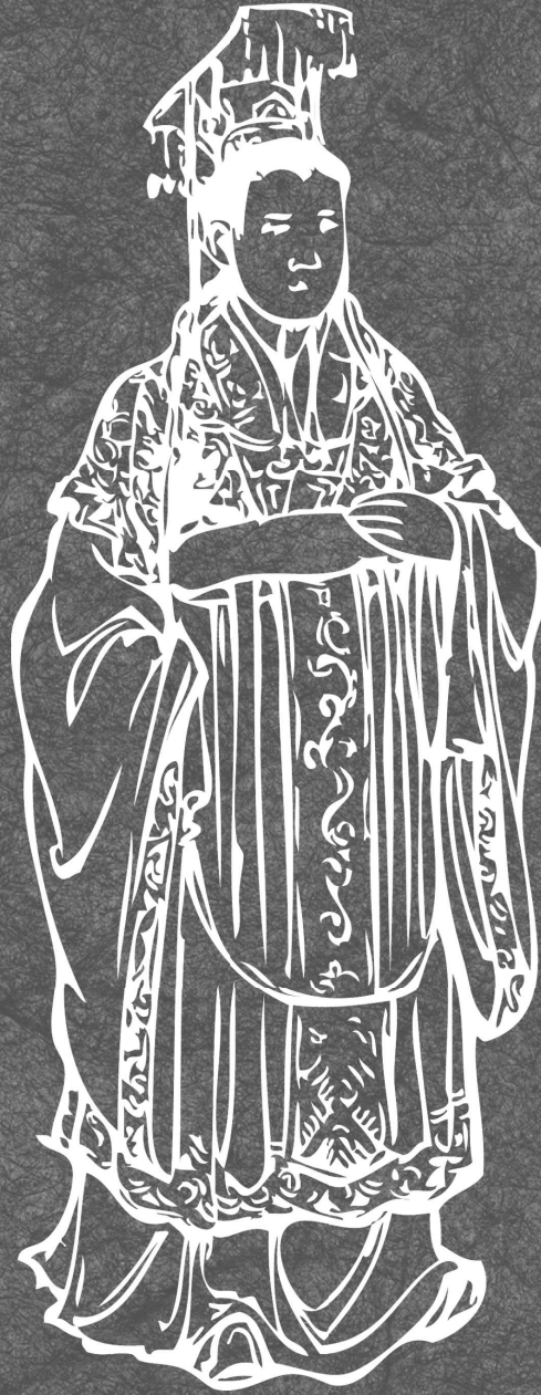
Сянь-ди — последний император династии Восточная Хань