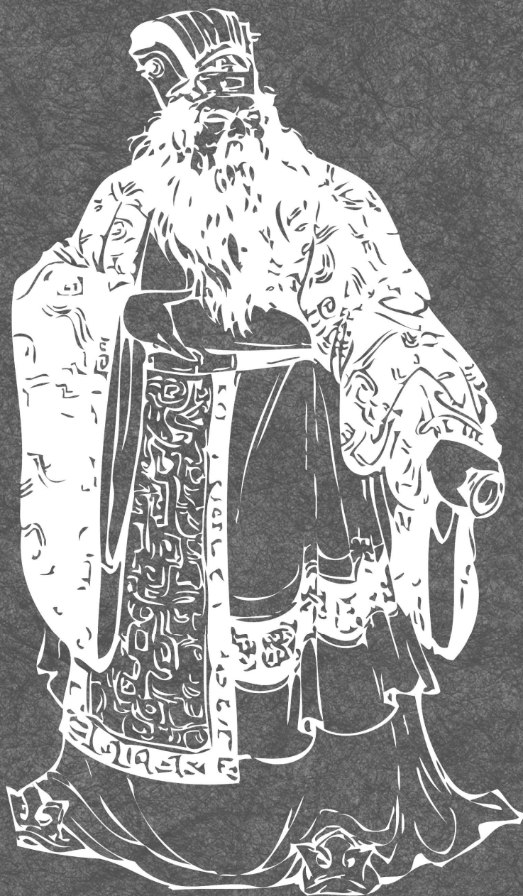
Дун Чжо — могущественный полководец заката династии Хань, в результате мятежа узурпировал власть