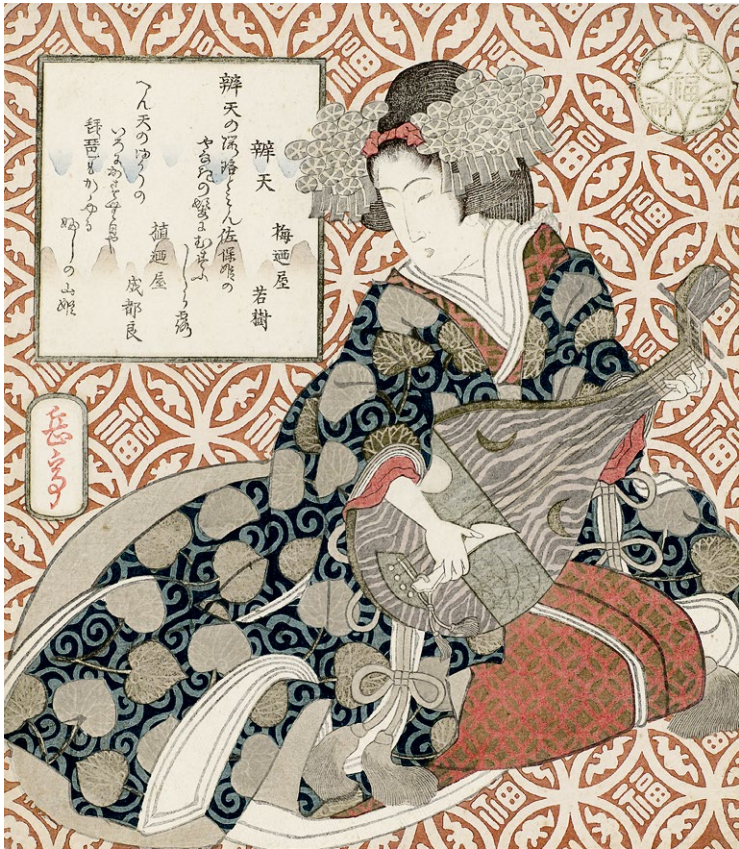
Куртизанка в образе богини Бентен

окончания Второй мировой войны, лишил ее многих самобытных черт. Но все же внешние влияния не смогли уничтожить эту самобытность до конца. Ведь японцы на протяжении всей своей истории отличались очень важным умением: перенимать основные элементы чужеземной культуры, но со временем интегрировать в собственную, адаптировать, изменяя эти заимствования до неузнаваемости.