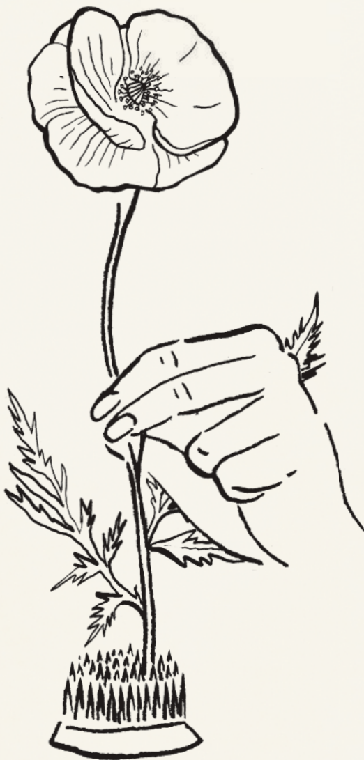
Как пользоваться наколкой