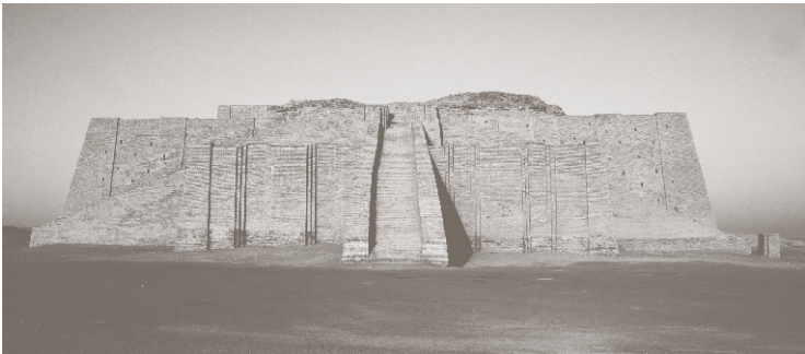
Руины зиккурата — многоступенчатого культового сооружения — в Уре

В середине III тыс. до н. э. юг Месопотамии подчинили себе аккадские племена. В отличие от шумеров, чей язык не имеет аналогов в современном мире, народ завоевателей говорил на языке семитской группы (в нее также входят, например, арабский и еврейский языки). Аккадцы дали местным божествам семитские имена, но, кроме того, принесли с собой и собственных богов, которые вошли в шумерский пантеон на правах второстепенных. Так, бог мудрости Энки получил имя Эа, бог солнца Уту стал Шамашем, а богиня войны и любви Инанна стала называться Иштар.