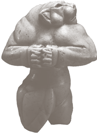
Антропоморфная скульптура, львица Гуэннола, ок. 3000–2800 гг. до н. э.

Также хочу выразить большую признательность издательству «Манн, Иванов и Фербер» за то, что данный труд воплотился в жизнь.