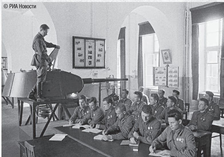
Занятия в Военной Академии им. Сталина. Москва, июнь 1941 года.

битвы было вызвано тем, что советское командование почему-то не заметило концентрации немецких войск в кулак, направленный на Москву, а также еще и тем, что немецкая разведка выяснила, где находятся штабы, пункты связи и управления Западного и Резервного фронтов. Сделать это было нетрудно: не менее месяца они располагались в одних и тех же местах, — периодически переносить их на новое место почему-то никому в голову не пришло. В первый же день наступления немцы нанесли мощный огневой удар по штабам всех уровней; был разбит даже командный пункт командующего Западным фронтом Ивана Конева в Касне, удаленный на 110 километров