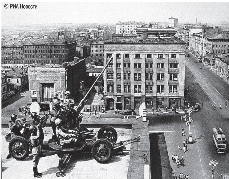
Зенитчики обороняют небо столицы.