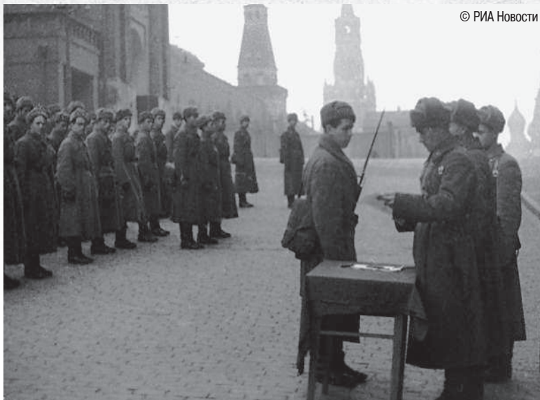
Бойцы принимают присягу на Красной площади. Июль 1941 г.