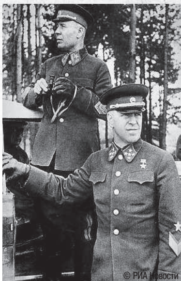
Маршал Советского Союза Семен Тимошенко (слева) и генерал Георгий Жуков (справа) на учениях войск Киевского особого военного округа. 1940 г.

Георгий Жуков прилетел из Ленинграда. Сталин поручил ему немедленно выехать на Западный и Резервный фронты: «Тщательно разберитесь в положении дел и позвоните мне оттуда в любое время...» В тот же день Жуков выехал в штаб Западного фронта и прибыл туда уже ночью. «Из беседы в штабе Западного фронта и анализа обстановки у меня создалось впечатление, что катастрофу в районе Вязьмы можно было бы предотвратить. Несмотря на превосходство врага в живой силе и технике, наши войска могли бы избежать окружения. Для этого необходимо было своевремененно, более правильно