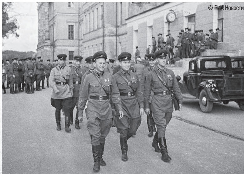
Выпускники Военной Академии им. Сталина. Москва, июнь 1941 года.

Катастрофическое поражение советских войск на первом этапе Московской