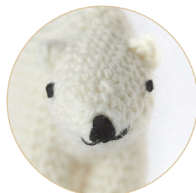
Белый медведь 30/32