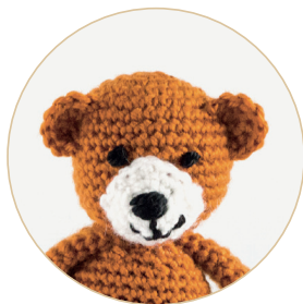
Маленький медведь 52/53