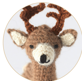
Северный олень 18/19