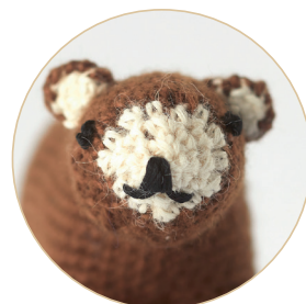
Бурый медведь 34/35