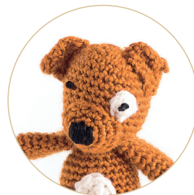
Маленькая собачка 56/59