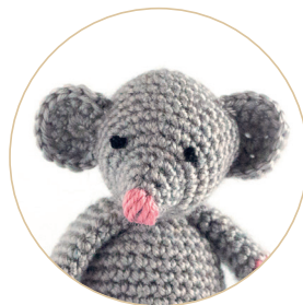
Маленькая мышка 54/55