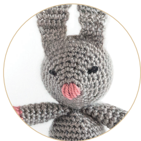
Маленький кролик 50/51