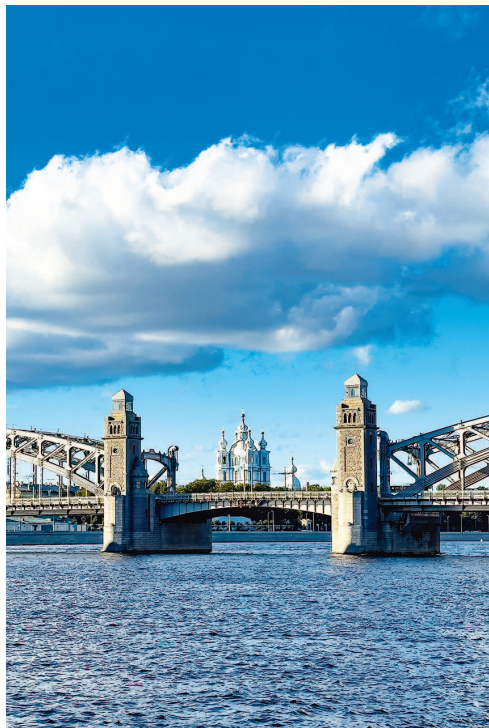
Большеохтинский мост. Неподалеку — Охтинский мыс, на котором стояла шведская крепость Ниеншанц, разрушенная войсками Петра

ли формироваться первые жилые районы нового города. С течением времени Санкт-Петербург устремился вширь, осваивались все новые и новые острова. Что же касается Петроградской стороны, то сейчас ее границы представлены, помимо Большой Невы, Большой Невкой и Малой Невой; с начала XVIII столетия эта часть города разрасталась от Петропавловской крепости на северо-запад. Она граничит с Василеостровским, Выборгским, Центральным и Приморским районами.