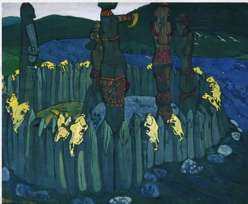
Николай Рерих. Идолы. 1901

Вятичи жили небольшими поселками, расположенными примерно в полукилометре друг от друга. Дома их были очень простыми — срубы-клетки, крытые тесом с крохотными оконцами или вовсе без окон. Зачастую они были с земляным полом и топились по-черному. Одевались мужчины в порты и рубахи, женщины — просто