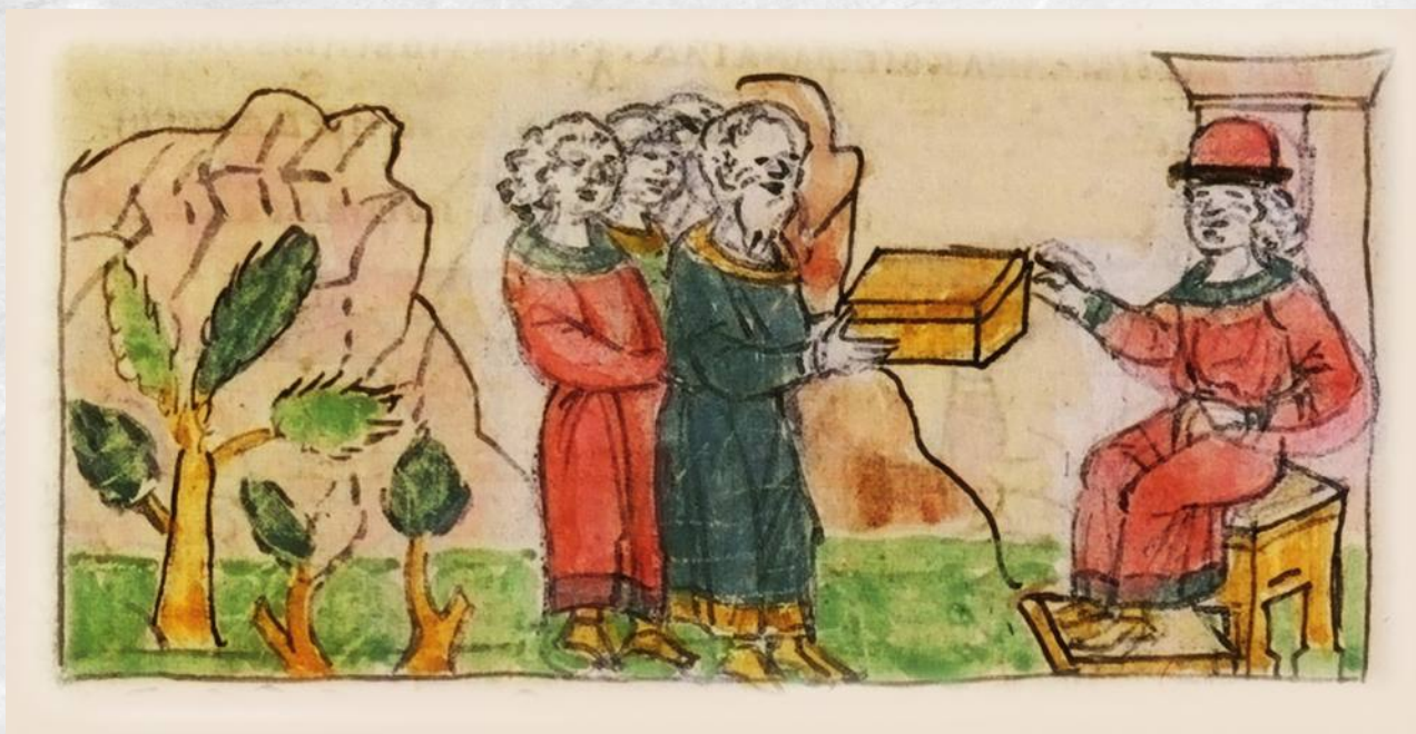
Вятичи платят дань Святославу Игоревичу. Радзивилловская летопись. XV век

Вспоминают некую благочестивую супружескую чету — Подона и Сару, которые положили начало городу. Эти Подон и Сара так сильно любили друг друга, что после смерти обратились в два ручья, текущие рядом. Ручьи с такими названиями действительно существовали.