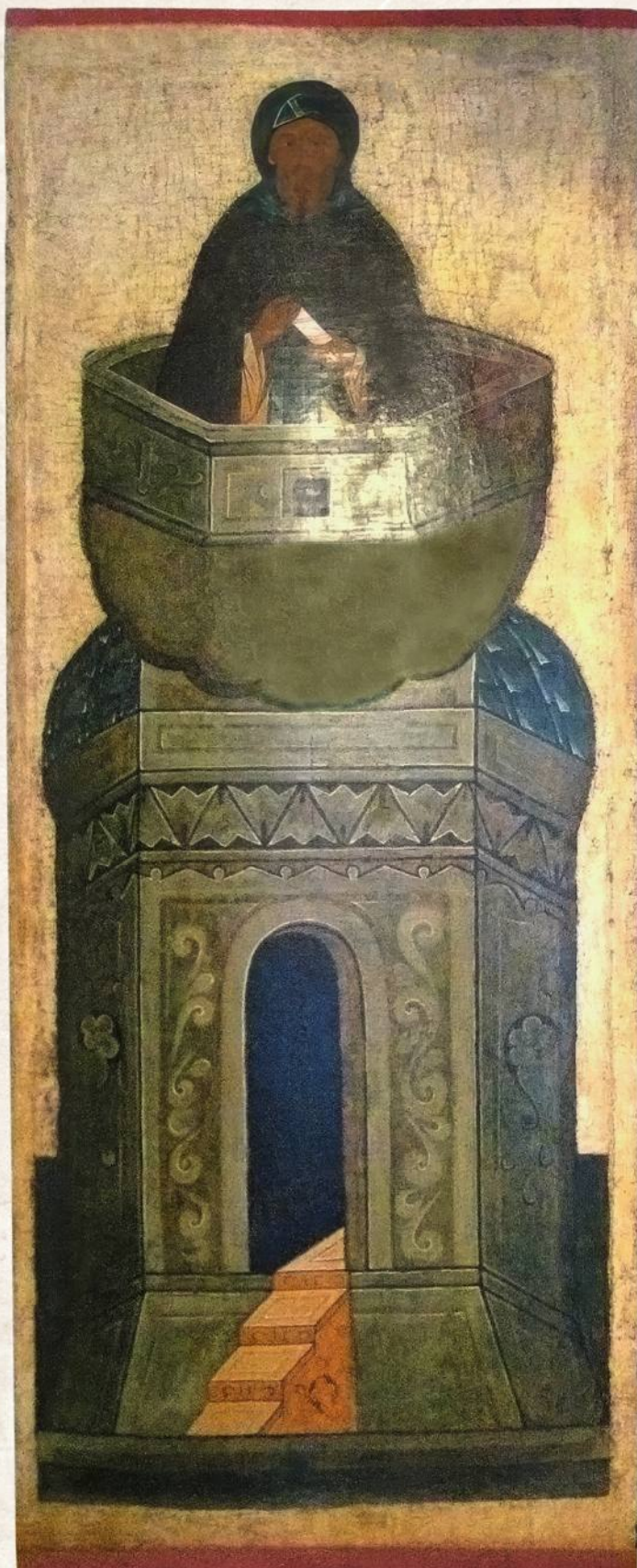
Даниил Столпник. Икона. 1550-е

Даниил Александрович основал и другой монастырь — Богоявленский, располагавшийся совсем рядом с Кремлем в современном Богоявленском переулке в Китай-городе. Выстроил князь и собор Спаса Преображения на Бору в Кремле, не дошедший до наших дней, а на Крутицах — архиерейский дом и храм.