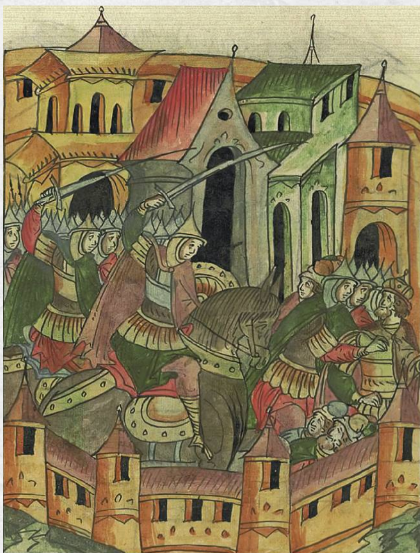
Разорение Москвы монголами и захват Владимира Юрьевича в плен. Лицевой летописный свод.