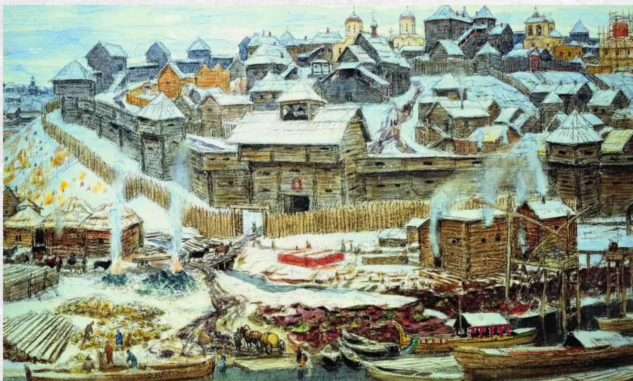
Аполлинарий Васнецов. Московский Кремль при Иване Калите. 1921

«кремль» происходит от греческих слов «кремн» или «кримнос», обозначающих крутую гору над оврагом или речным берегом. Именно такой горой и был Боровицкий холм, на котором стоял Кремль! Ну а автор словаря живого великорусского языка Владимир Даль приводил слово «кремлевник», обозначающее хвойный лес на болотистом месте. А ведь на Боровицком холме некогда шумел бор, да и берега Неглинки были болотистыми!