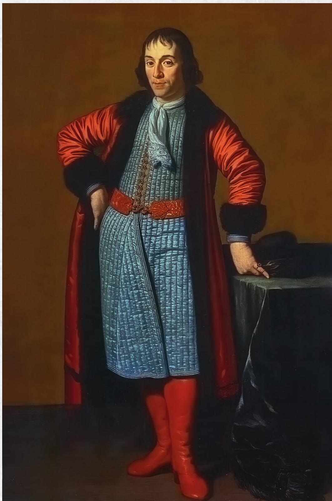
Михель ван Мюссхер. Портрет А. Меншикова, написанный в Голландии во время Великого посольства. 1698