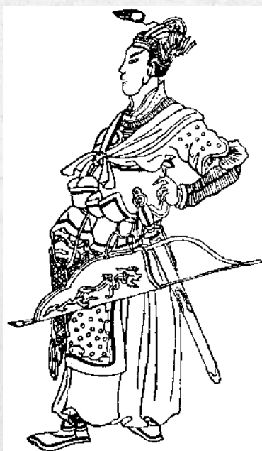
Батый (Бату). Средневековый китайский рисунок. XIV век

небольшое Московское княжество было передано в удел младшему сыну великого князя Александра Невского Даниилу Александровичу. От Даниила Александровича