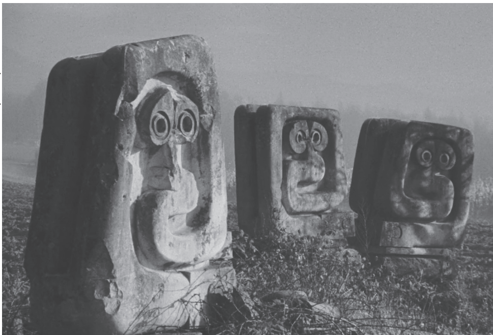
Йохан Йоханссон. Последние и первые люди. 2020. Кадр из фильма

У Яна Кемпенарса споменики предстают прежде всего загадкой, руинами цивилизации, о которой мы ничего не знаем, их смысл и назначение от нас ускользают. Бельгийский фотограф представил социалистическое как экзотическое — и в этом качестве фотографии спомеников становятся невероятно популярными в интернете. Их популярность несколько двусмысленна. Так, британский автор Оуэн Хатерли пишет о неуместности спомеников в контексте проектов, посвященных памятникам тоталитарных режимов 20 века. В отличие от большинства советских монументов, югославские памятники вовсе не были образцами соцреализма [1].