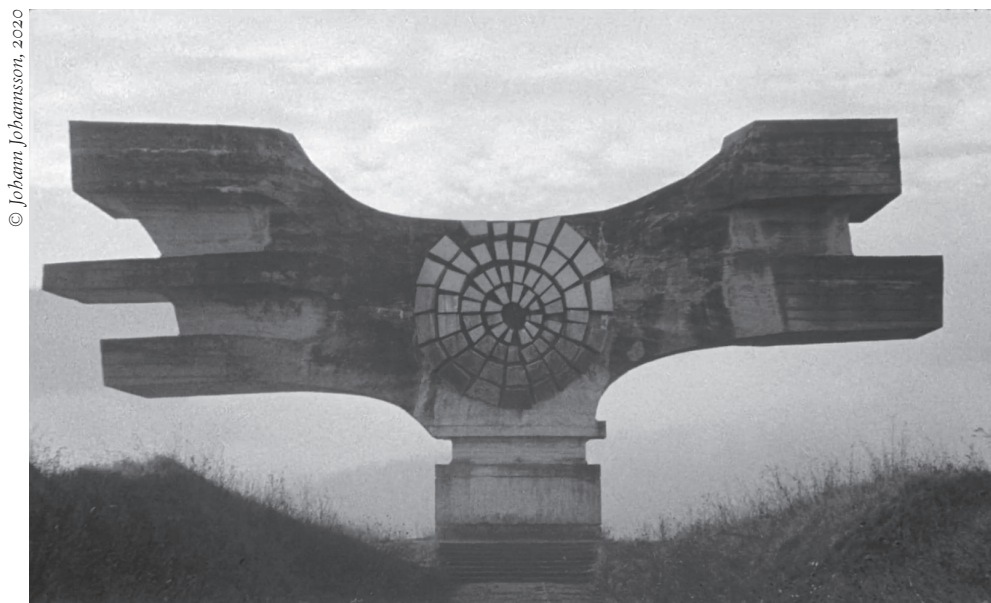
Йохан Йоханнссон. Последние и первые люди , 2020. Кадр из фильма

Вышедший в 2020 году фильм «Последние и первые люди» исландского композитора Йохана Йоханнссона ( Johann Johannsson, 1969–2018 ) как нельзя лучше подходит для начала разговора о хонтологии, или «призракологии», о руинах современности и парадоксальных путешествиях в прошлое в поисках утраченной перспективы будущего.