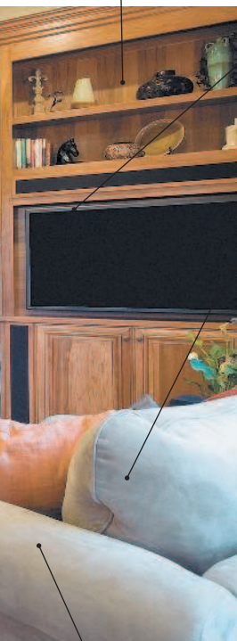
il divano диван