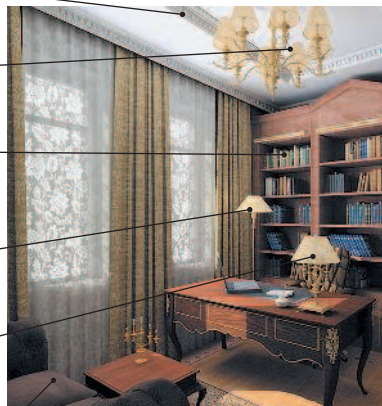
lo studio кабинет