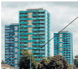
il caseggiato многоквартирный дом