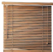
la veneziana жалюзи