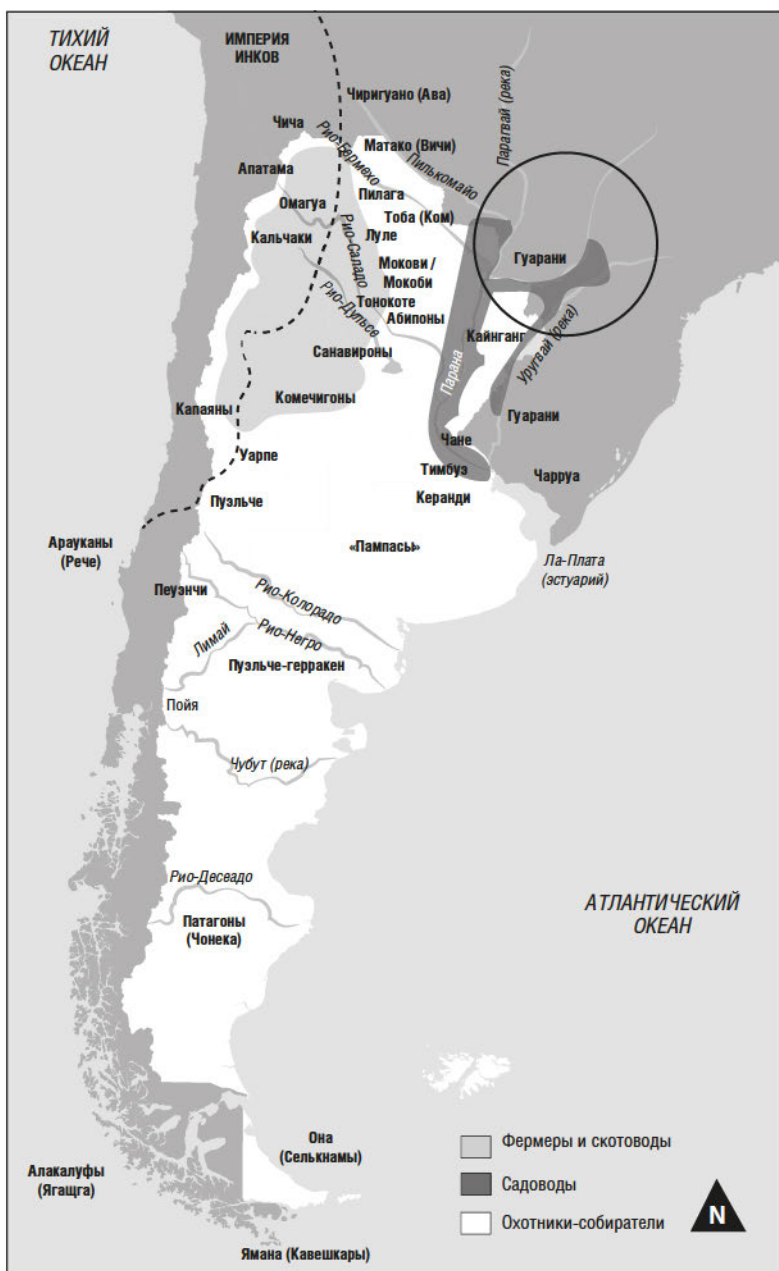
Карта 1.1. Аборигены около 1500 года.

Адаптировано из книги Пабло Янкевича «Минимальная история Аргентины» ( Historia minima de Argentina )