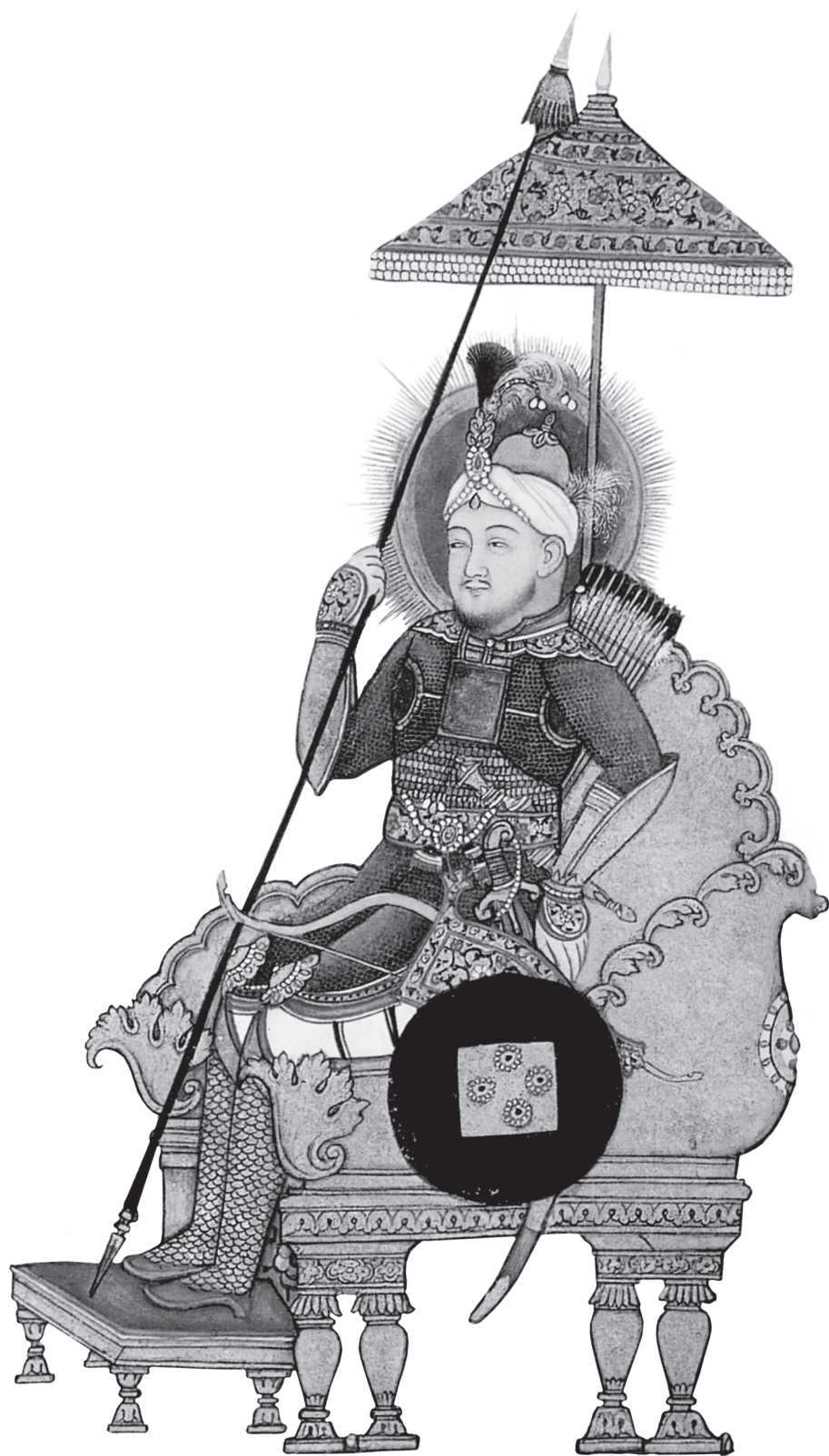
Тимур. Могольская миниатюра XVIII в.