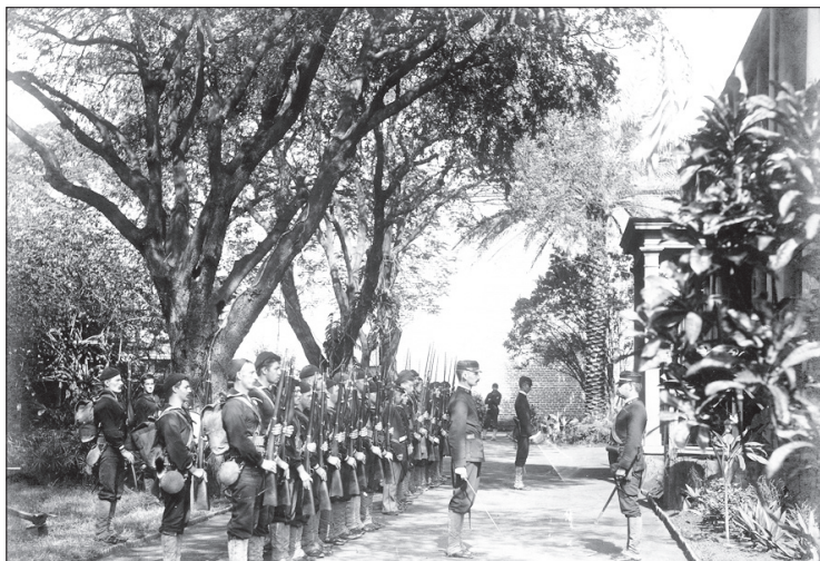
Отряд американских матросов, совершивших переворот на Гавайях

а в 1900 году, когда острова стали американской территорией, занял пост губернатора.