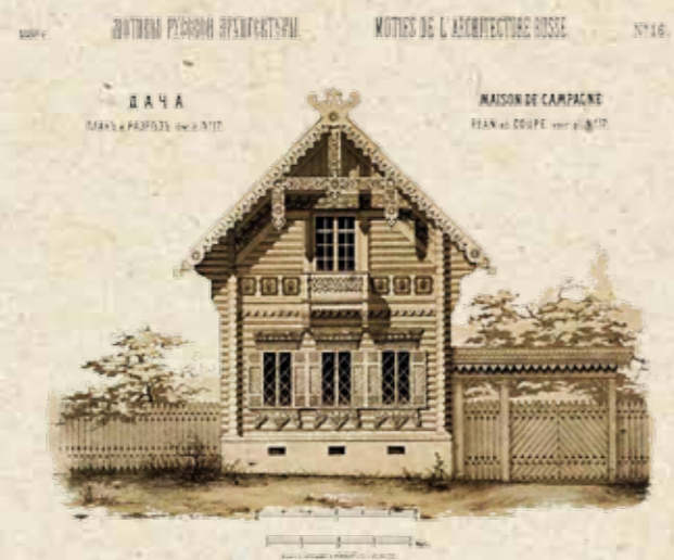
Иллюстрация из сборника «Мотивы русской архитектуры», 1880

Впрочем, детально об архитектуре дач можно говорить лишь в тех случаях, когда к работе была приложена рука архитектора, а в основе строительства лежали не только идея, но и четкий план. Чаще же дачи строились стихийно. Простенькие дома постепенно обрастали пристройками, террасами и верандами, вторым этажом, балконами, эркерами. Такой подход «самостроя», конечно же, не предполагал стилистически выдержанной концепции, однако именно его можно считать основной особенностью русской дачи.