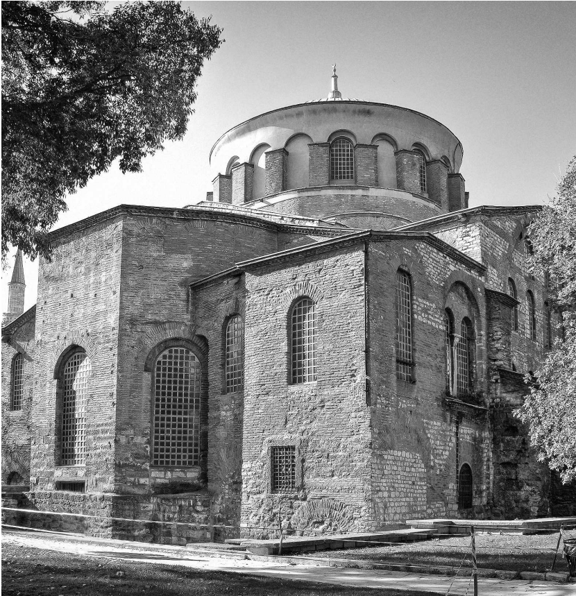
Церковь Св. Ирины. 530-е гг. и кон. VIII в.

в упадок и использовались как материал для строительства домов. Лучшая участь была уготована субструкциям светских и церковных сооружений. Они использовались (и используются по сей день) как фундаменты или подпорки для новых стен и благодаря этому доступны сегодня исследователям. Подобные научные исследования проводились с 1873 года в нижних частях Большого императорского дворца, когда вдоль Мраморного моря проклады-