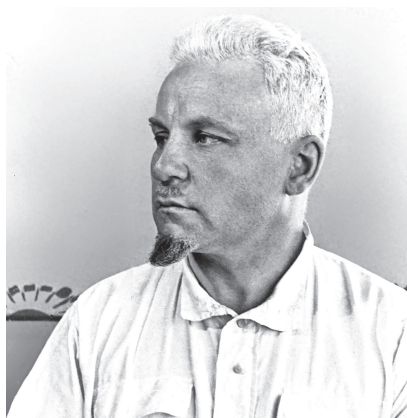
Артур Христианович Артузов (1891–1937) — деятель советских органов государственной безопасности. Один из основателей советской разведки и контрразведки, корпусной комиссар (1935)

В 1934 году в СССР существовало четыре самостоятельные разведывательные службы. Это Иностранный отдел НКВД, Раз-