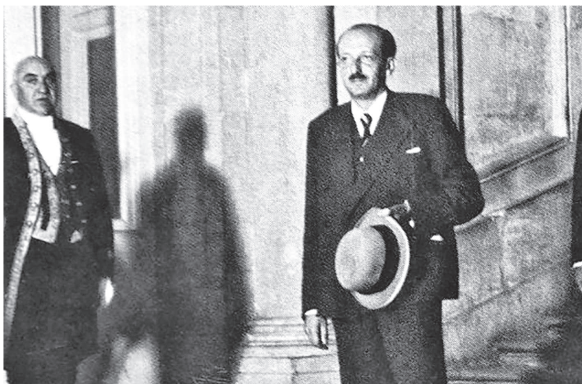
Марсель Израилевич Розенберг (1896–1938) — советский дипломат. Первый представитель СССР в Лиге Наций. Во время Гражданской войны в Испании — полпред СССР при республиканском правительстве.

нако объединенные резидентуры Разведупра и НКВД в канун войны и когда она началась оказались очень уязвимыми. Связники и курьеры зачастую знали агентов, принадлежавших к различным советским спецслужбам. А провалы советской разведки в конце двадцатых — начале тридцатых годов в Польше и Китае вообще заставили в 1939 году отказаться от работы в рамках объединенных резидентур военной и политической разведки.