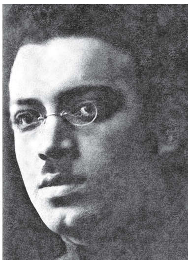
Абрам Аронович Слуцкий (1898–1938) — деятель советской разведки, комиссар государственной безопасности 2-го ранга (1935). Руководитель Иностранного отдела (внешняя разведка) ГУГБ НКВД СССР (1935–1938). Убит сотрудниками НКВД во время репрессий в НКВД 1937–1938 годов.

ведуправление Красной армии, отдел международной связи Коминтерна и Специальная группа особого назначения при наркомате внутренних дел (СГОН) Я. Серебрянского («Группа Яши»). В этих условиях Артузов по совместительству был назначен заместителем начальника военной разведки. Почему? Потому что речь шла о необходимости кардинального укрепления контрразведывательного обеспечения закордонной работы нашей разведки. Опыт Артузова, знание им русской эмиграции, которая была одним из основных источников формирования агентуры, больше всего нужны были в этот период. Вскоре Артузова в качестве начальника ИНО сменяет А. Слуцкий. Артузов возвращается вновь в НКВД в 1937 году в качестве консультанта, рядового сотрудника.