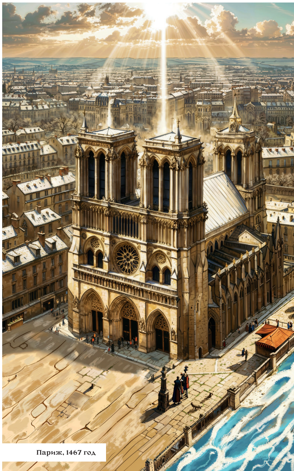
Париж, 1467 год