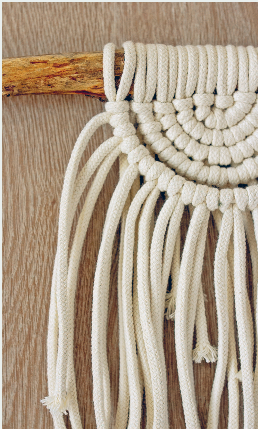
Пример плетения из хлопкового шнура ▶