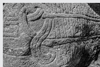
Рунный камень Харальда в Дании

Для наглядности возьмем одну сюжетную основу — божественная власть нисходит с небес на землю — и посмотрим, как она реализуется в различных мифологических системах. В древнегреческой мифологии сын богини дневного света Гемеры Уран, олицетворяющий небо, сочетался браком с Геей — Землей, породив множество дивных существ. Громовержец Зевс — царь богов, внук Урана и Геи — взирал на людей с неприступной вершины Олимпа. Среди детей, родившихся от союза Зевса со смертными женщинами, не только герои, но и цари. Самая известная и почитаемая богиня японского пантеона, Аматаэрасу, — олицетворение солнца, праматерь императоров. В германо-скандинавской мифологической традиции верховным божеством является Один (Водан, Водан), мудрец и бог войны (в греческом пантеоне таким сочетанием функций могла похвастаться Афина). Среди его сыновей Тор — опять же бог-громовержец (как тут не вспомнить еще и славянского Перуна!); Ингви, считавшийся родоначальником династии королей