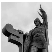
Статуя викинга Ингольфура Арнарсона, семья которого поселилась в Исландии в 874 году. Рейкьявик, Исландия

Чем суровее условия жизни, чем больше усилий должен прилагать человек для выживания, тем драматичнее сказания. Это в полной мере касается скандинавских саг — части германо-скандинавской мифологии. Предки современных