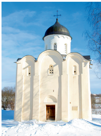
Церковь Святого Георгия в Старой Ладоге. XII в.