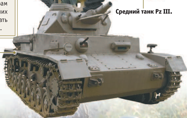
Средний танк Pz IV.