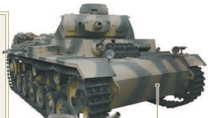
Средний танк Pz III.

Pz IV разрабатывался как тяжелый танк прорыва. Однако в момент создания он едва дотягивал по характеристикам до советского среднего танка Т-34. Тем не менее в дальнейшем германским конструкторам удалось довести конструкцию Pz IV до уровня лучших стандартов. Танкам Pz III и Pz IV суждено было стать «двигателем» вермахта времен его побед и успехов.