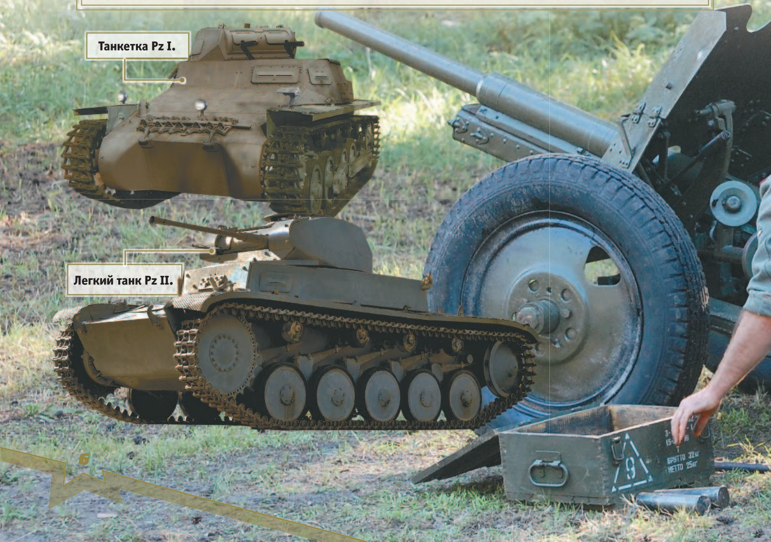
Легкий танк Pz II.