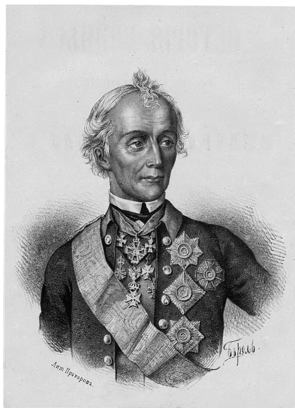
СУВОРОВЪ АЛЕКСАНДР ВАСИЛЬЕВИЧ 1730 — 1800