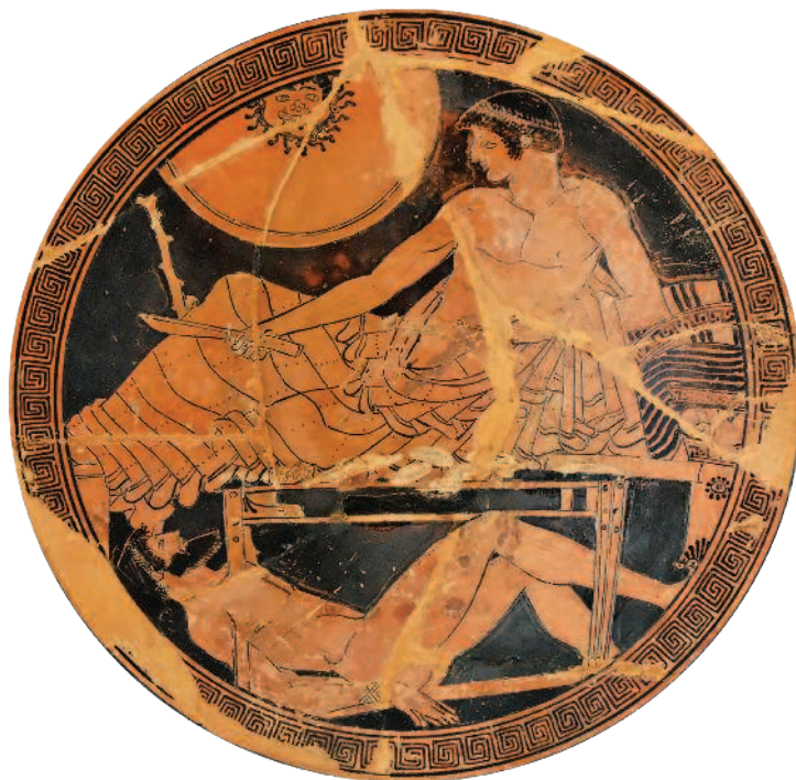
РИС. 1.5. АХИЛЛ С ТЕЛОМ ГЕКТОРА. РИСУНОК НА ГРЕЧЕСКОЙ ВАЗЕ. V ВЕК ДО Н. Э. ЛУВР. НА ЩИТЕ АХИЛЛА МОЖНО РАССМОТРЕТЬ УСТРАШАЮЩЕЕ ИЗОБРАЖЕНИЕ ГОРГОНЫ МЕДУЗЫ

Судя по всему, в Древнем Китае, античной Греции и Риме уже активно применяются личные, индивидуальные символы, которые воины и полководцы размещали на своих щитах и шлемах: так, изображая на щите волка или скорпиона, солдат рассчитывал таким образом