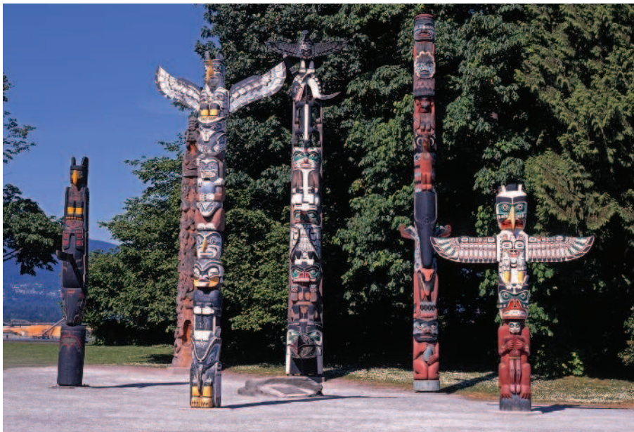
РИС. 1.3. СОВРЕМЕННЫЕ ИНДЕЙСКИЕ ТОТЕМНЫЕ СТОЛБЫ В ВАНКУВЕРЕ, КАНАДА

Разные народы использовали свои системы знаков для передачи той или иной информации. Это могли быть разноцветные ракушки, в определенной последовательности нанизанные на прут или лозу; зарубки на дереве; рисунки, оставленные на стенах пещер или примитивных построек. Видно, что уже в те далекие времена формировались вполне конкретные системы знаков и символов, которые в иносказательном виде — задолго до рождения письменности — могли донести до людей нужные сведения.