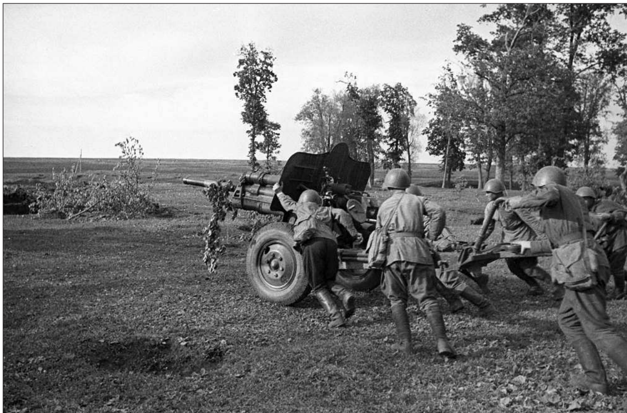
Советские артиллеристы выкатывают на боевую позицию 76-мм дивизионную пушку образца 1939 года

В феврале 1921 года пришел приказ Фрунзе о роспуске бригады. Стоявшие в селе Покровское кавалеристы расслабились, начали готовиться к отъезду по домам. Через несколько часов на взмыленной лошади, которая тут же посреди улицы пала, примчался гонец. В 40 километрах от Покровского махновцы захватили, пытали и изрубили тридцать фуражиров из 1-го полка их бригады. Еще сорок красноармейцев-кубанцев забаррикадировались на мельнице и просят подмоги. Стихийно собравшись, вся бригада отправилась на выручку.