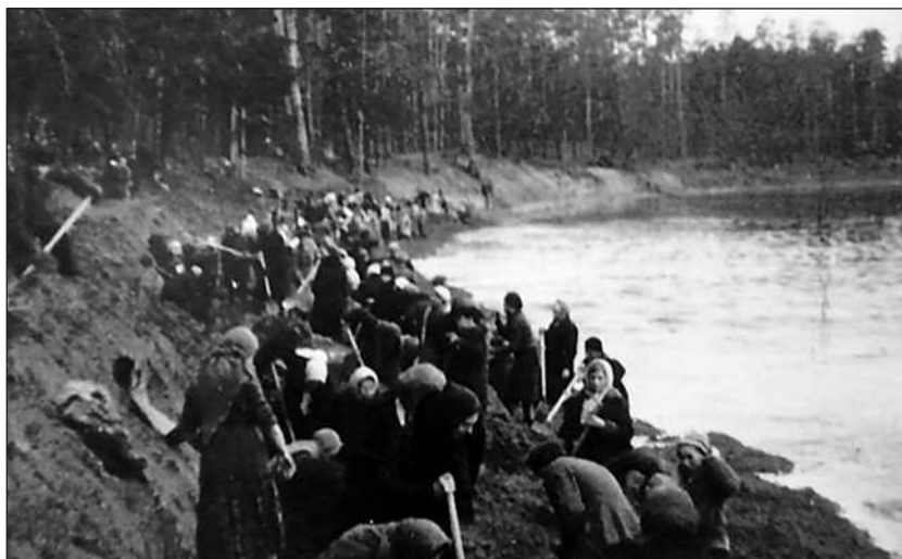
Эскарпирование берега реки мобилизованным населением