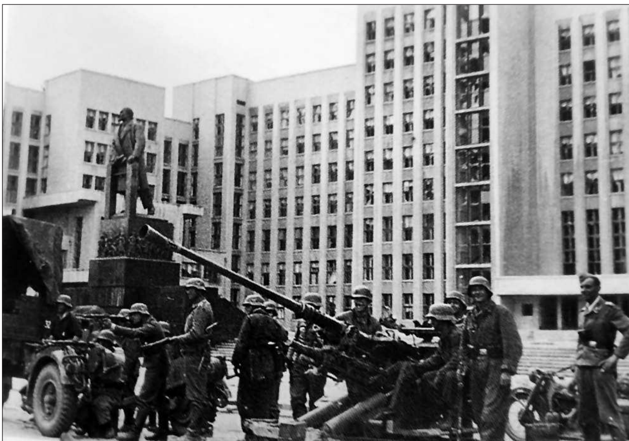
Расчет немецкого 37-мм зенитного орудия Flak 37 перед Домом правительства в оккупированном Минске