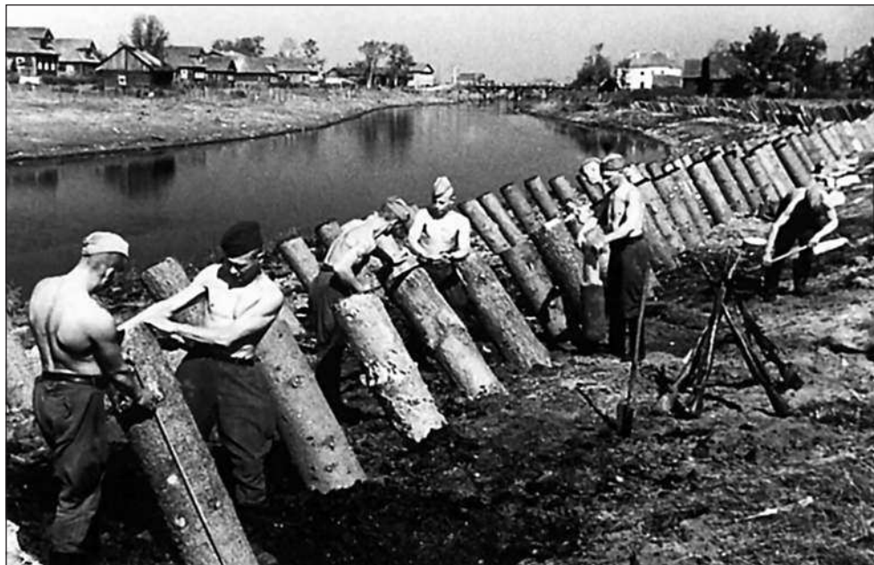
Установка советскими солдатами надолбов на берегу реки

начально были бесперебойными, только махорка завозилась от случая к случаю. Но затем в Москве решили перейти на приобретение продуктов питания у местных торговых организаций... и начались перебои, которые привели к неизбежному недоеданию.