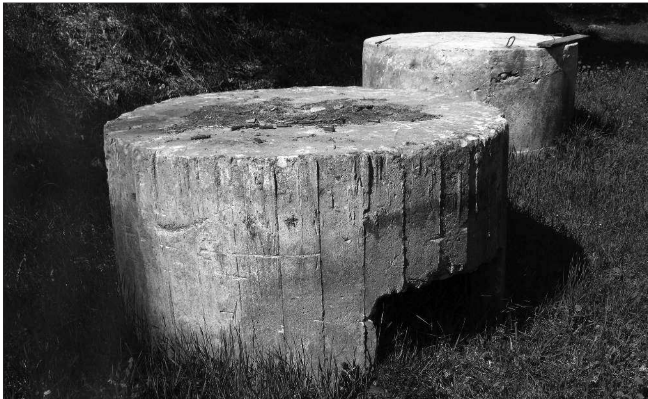
Железобетонные огневые точки (ЖБОТы)

Материально-бытовые условия оставляли желать лучшего. Поставки продовольствия перво-