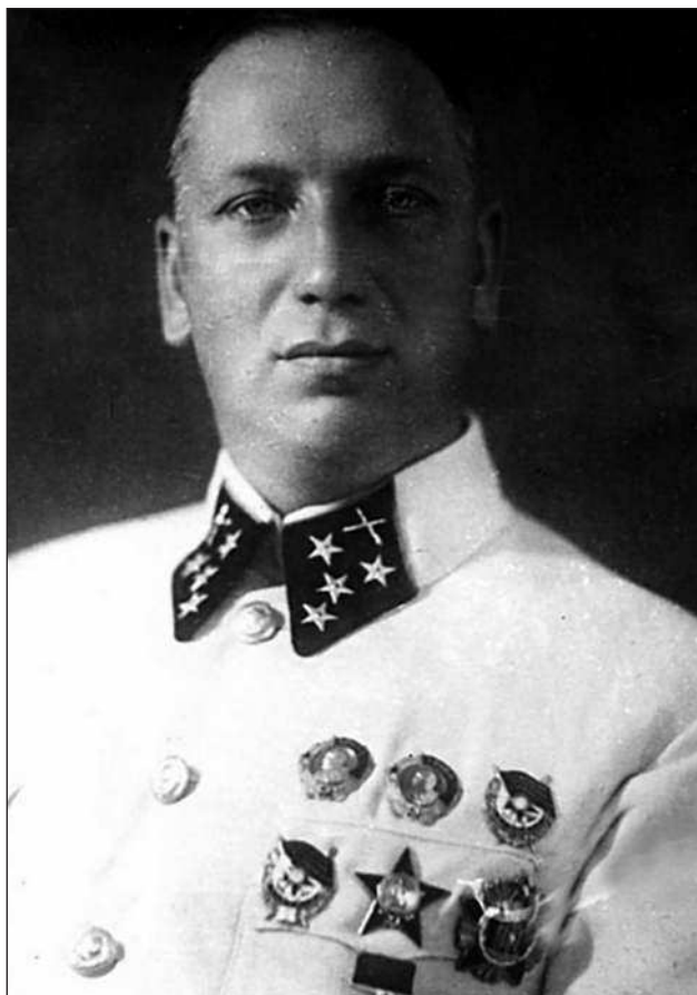
Воронов Николай Николаевич. В июле – октябре 1941 г. — генерал-полковник, начальник артиллерии РККА