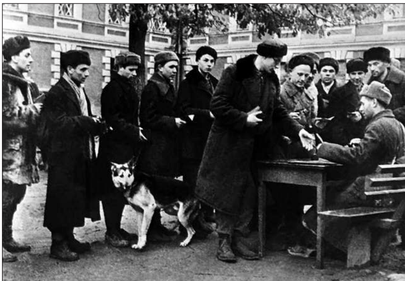
Жители Москвы в очереди на формирование рабочего батальона Первомайского района

Отсутствие у рекогносцировщиков надлежащего опыта приводило к их стремлению разместить оборонительные сооружения слишком близко к переднему краю — в 50, а в некоторых случаях даже в 30 метрах, и располагать их слишком близко друг от друга — иногда даже в 100 метрах. Ими делался упор на возведение сооружений фронтального огня, в то время как советская фортификационная наука уже давно доказала эффективность использования флангового и косоприцельного огня, для чего следовало строить капоныры и полукапоныры.