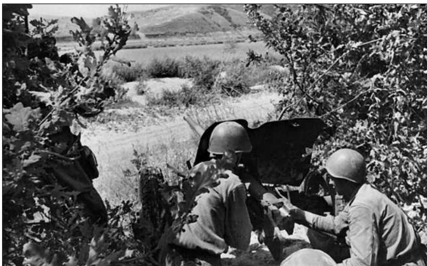
Расчет советской 45-мм противотанковой пушки образца 1937 года (53-К)

Оказалось, что в ней находится 1-й заместитель командующего Западным фронтом генерал-лейтенант Иван Васильевич Болдин, а с ним еще один генерал и шофер. Комфронта отправил Болдина к окруженным западнее Минска частям, чтобы он на месте в тылу у немцев организовал мощный контрудар. Однако вскоре выяснилось, что реализовать этот план невозможно: из-за отсутствия связи, постоянных ударов противника и бомбежек подразделения полностью потеряли управляемость и фактически рассыпались.