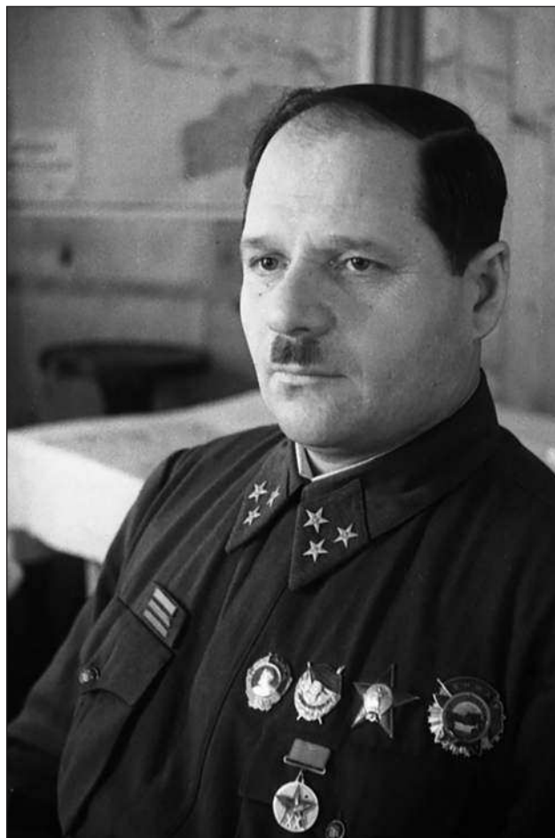
Болдин Иван Васильевич. В июне – августе 1941 г. — генерал-лейтенант, 1-й заместитель командующего Западным фронтом

К 28 июня закончилось топливо, и пришлось остановиться в лесу и спрятать всю остальную технику. Во-