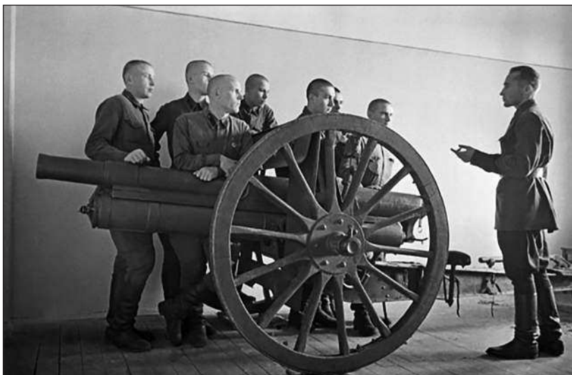
Занятие в ПАУ