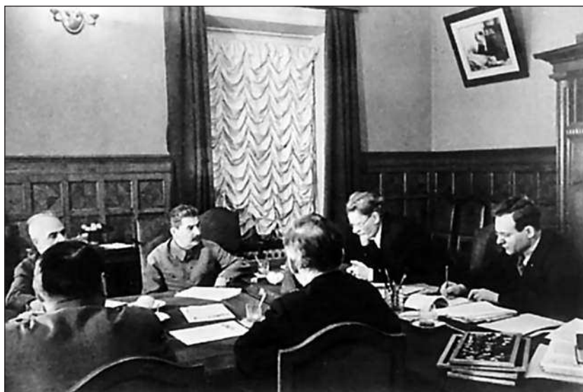
Заседание Государственного Комитета Обороны

Управление оборонительного строительства сформировало 7 армейских управлений военно-полевого строительства (АУВПС). Военный совет МВО приступил к формированию рабочих батальонов из лиц старших возрастов, не подлежавших военной мобилизации. На земляные работы массово привлекалось гражданское население Москвы и Московской области. Всего при возведении Можайской линии, начиная с лета и заканчивая декабрем 1941 года, было задействовано до 500 тысяч человек, из которых 75 % — женщины. Непосредственно в 37-м УРе во второй половине августа одновременно было задействовано около 13 тыс. рабочих, а на 22 сентября — 22,5 тыс.