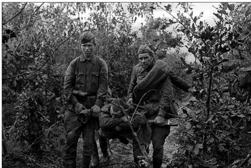
Советские солдаты выносят с передовой раненого