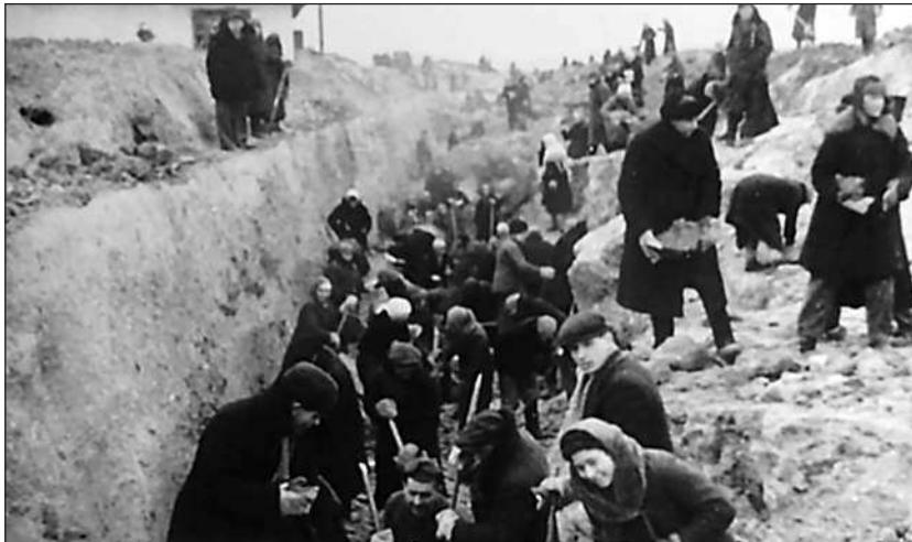
Мобилизованное население копает противотанковый ров

И тем не менее, несмотря на трудности, рабочие строили хорошо, а потому планы строительства в целом выполнялись. К моменту выхода немецких войск к Можайской линии обороны (10 октября 1941 года)