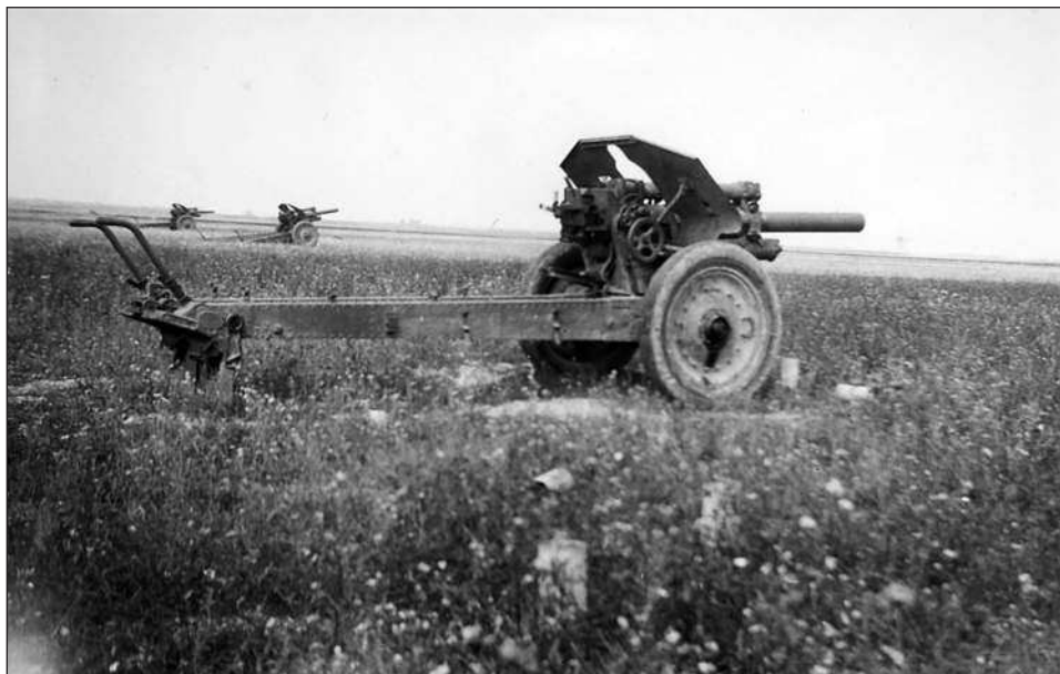
Батарея советских 122-мм гаубиц образца 1938 года (М-30), брошенная на позиции в открытом поле