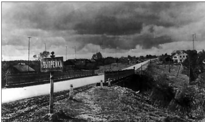
Мост через речку Выпрейку и село Ильинское до начала боев

Управление 37-го УРа формировалось медленно, штаб с задержками получал командный состав и транспорт и был окончательно укомплектован только к концу сентября. Прибывавший из запаса инженерно-технический состав никогда в армии не служил и не имел ни малейшего понятия о фортификации. Только три специалиста были кадровыми военными инженерами.