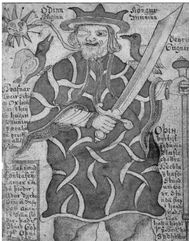
Один. Иллюстрация из исландской рукописи XVIII века

Но нет ли какой-нибудь более «приземленной» версии происхождения рун? Долгое время историки и филологи отталкивались от их странной формы — угловатой, геометрической, и старались найти аналогии в самых разных древних языках. Но впоследствии возникла гипотеза, что, возможно, «предки» германских рун выглядели несколько иначе, просто жители