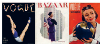
Обложки: Vogue - май 1940, Harper's Bazaar - сентябрь 1940, Vogue - февраль 1940.