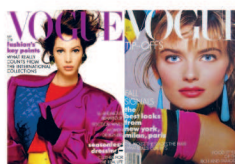
Обложки: Vogue - 1983 год.