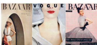
Обложки Harper's Bazaar - май 1950, Vogue - октябрь 1952, Harper's Bazaar - февраль 1952.