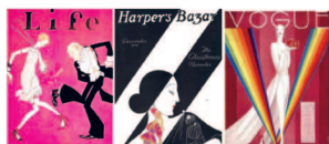
Обложки: Life февраль 1926, Harper's Bazaar декабрь 1924, Vogue сентябрь 1926