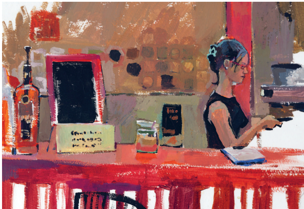
Автор работы: Анна Эгида (акрил, бумага)

Я отучилась, выпустилась, начала работать и продолжала рисовать.