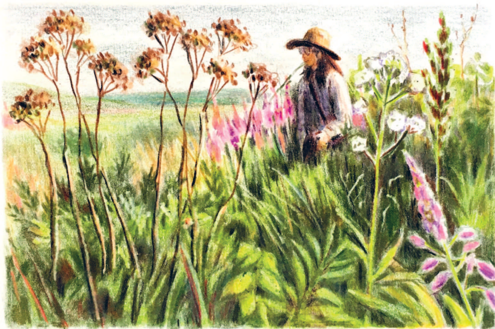
Автор работы: Наталья Политова (карандаши, бумага)

И я считаю, этот момент особенно опасен, поскольку можно угодить в ловушку зависимости от чужого мнения. Почему? Потому что обычно просят четкого ответа «да» или «нет»