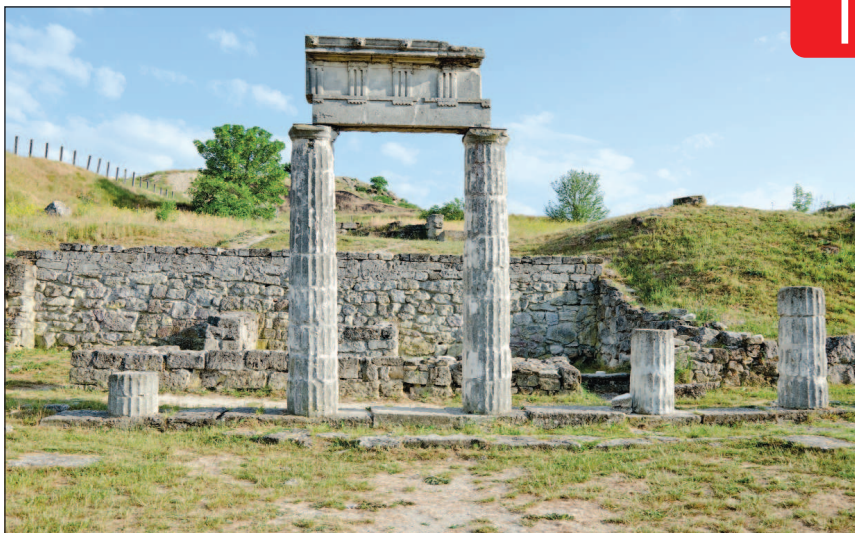
Руины древнего города Пантикапея