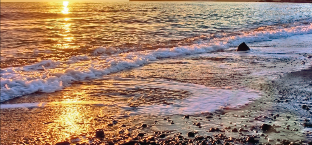
Вид на мыс Капчик в Новом Свете

Край мечтательных писателей и поэтов, вдохновенных художников, отважных мореплавателей, свободных воздухоплателей и преданных виноделов — одним словом, романтиков, которые сердцем выбрали этот особенный уголок на юго-востоке Крыма. «Киммерией» поэт Максимилиан Волошин называл участок от Судака до Керченского пролива, вдохновившись образами этой таинственной страны, воспетой Гомером.