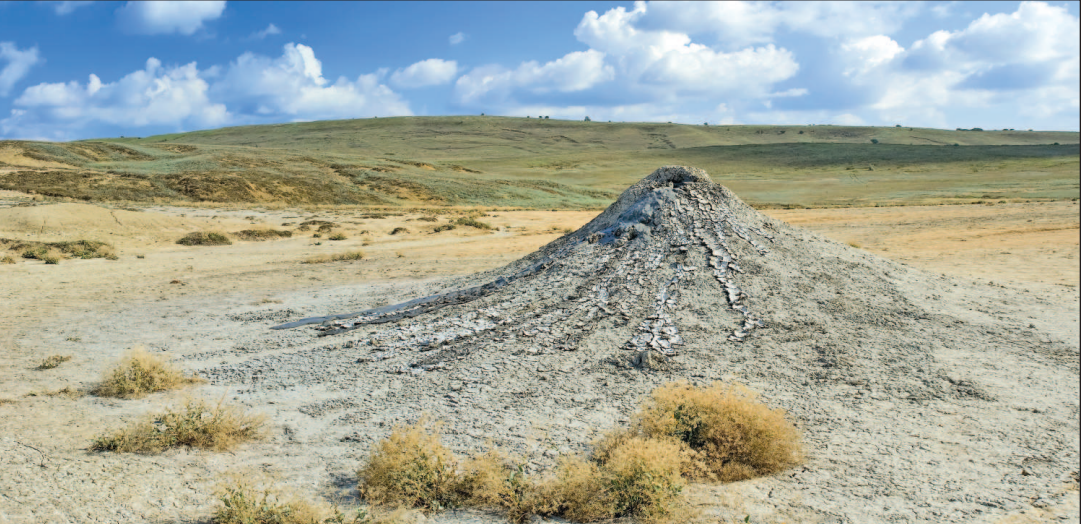
Конусообразный грязевой вулкан