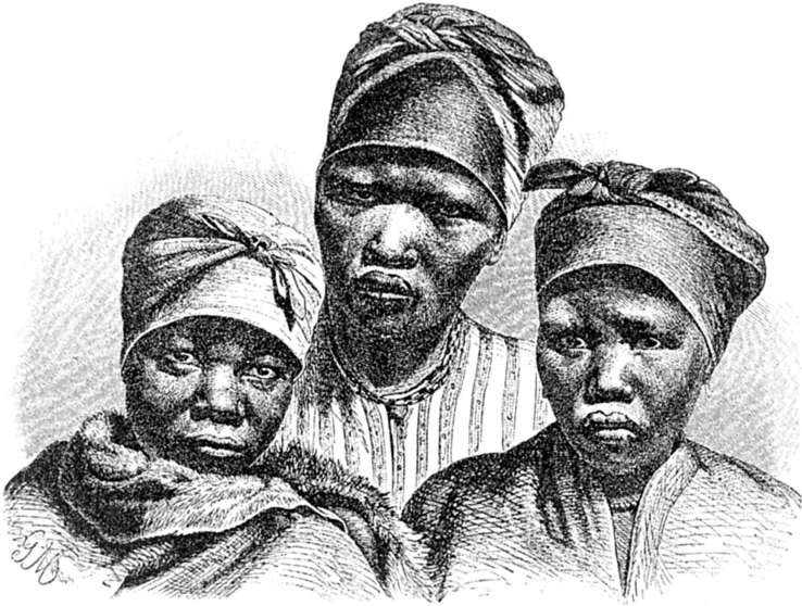
☒ Готтентотки племени номаков

Как украшение носили на руках металлические и сделанные из слоновой кости кольца. В уши продевали большие, тяжелые медные кольца, которые оттягивали ушную мочку до самых плеч. Женщины раскрашивали себе лицо, проводя красной краской круги вокруг глаз и дугообразные линии на лбу и щеках. Только одну свою старинную обувь готтентоты сохранили и до сих пор, они носят сандалии из коры или кожи, в таких сандалиях нога не тонет в сыпучем песке.