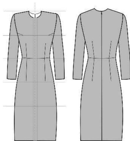
Технический эскиз модели

В описании к техническому рисунку изделия обязательно укажите следующие параметры.