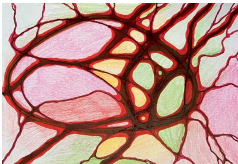
К стр. 216. Алгоритм Снятия Ограничений