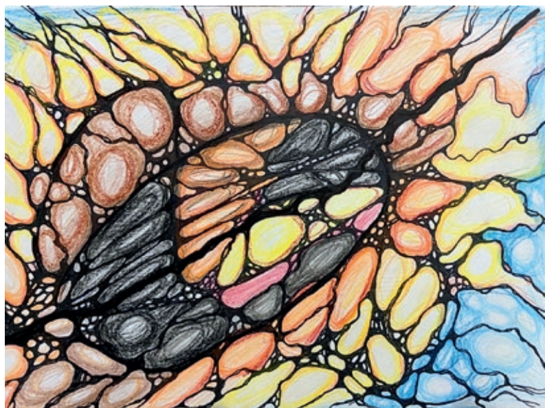
К стр. 153. Алгоритм Снятия Ограничений