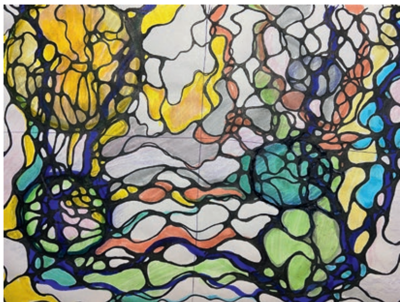
К стр. 93. Четвертый рисунок по теме «Я — женщина»