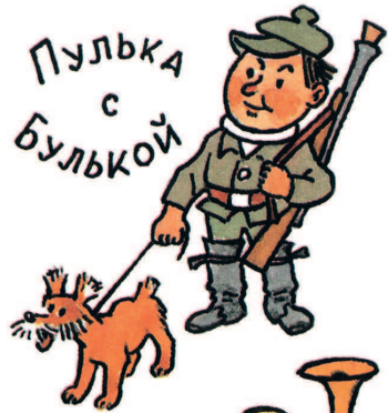
ПУЛКА С БУЛКОЙ