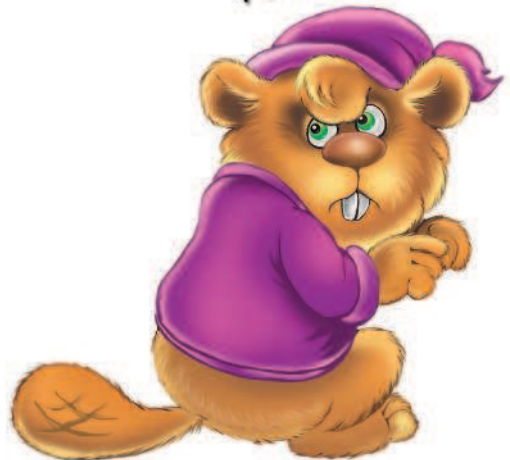
БОБЁР БОБРОВИЧ- ГРУЗЧИК