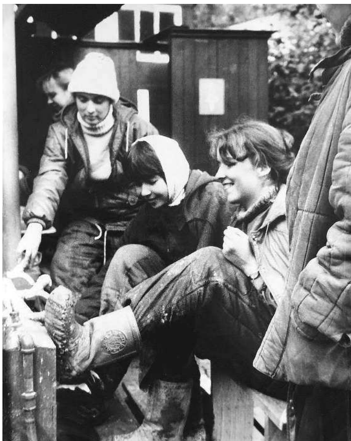
Это я на картошке

веку-невидимке мои претензии. Он, горестно покряхтев, понял, что время безопасных отношений по телефону прошло, и нехотя изъявил готовность явиться предо мной аки Сивка-Бурка. Спросил только обреченно: «Когда?»