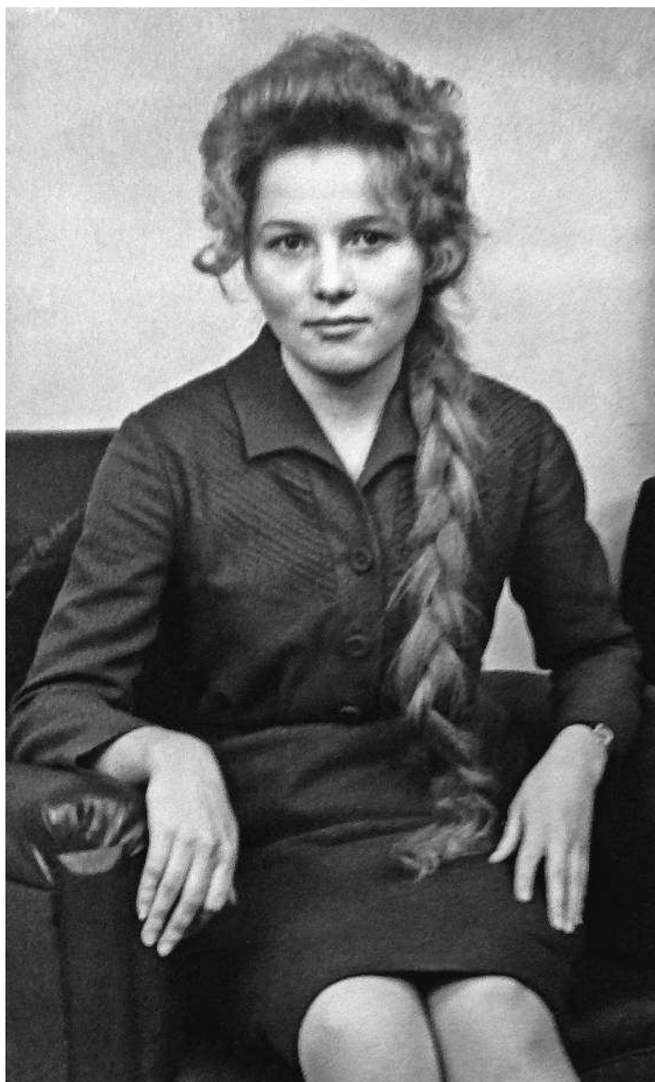
Мамуля в те далёкие дни