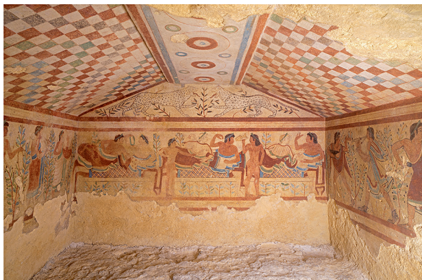
Нстенн я роспись в погреб льной к мере под н зв нием «Гробниц леоп рдов» в этрусском некрополе Т рквиини в Л цию, Италия. Ок. 470 г. до н.э.