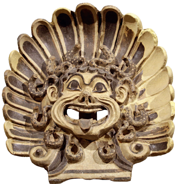
Голов Горгоны нтефикс (с открытым ртом).

Конец VI в. до н.э. Национальный музей этрусского искусства, Рим