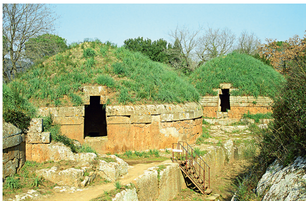
Некрополь Бндитчч в Черветери. VI в. до н.э.