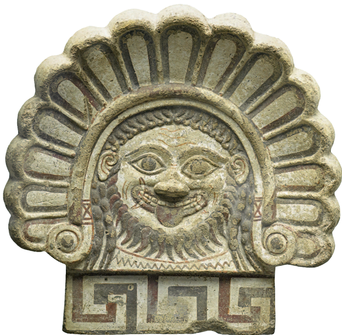
Голов Горгоны нтефикс. Конец VI в. до н.э. Национальный музей этрусского искусства, Рим

Отличительной особенностью этрусского искусства можно назвать и его улыбчивость — знаменитая и именно так и называемая «этресская улыбка». Им удалось поймать улыбку вечности, которая сопровождает все изображения и особенно читается в скульптуре — например, в статуе Аполлона в Вейях.