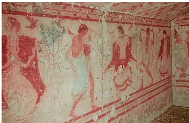
Н стенн я роспись (дет ль) в погреб льной к мере под н зв нием «Гробниц леоп рдов» в этрусском некрополе Т рквинии в Л цию, Италия. Ок. 470 г. до н.э.