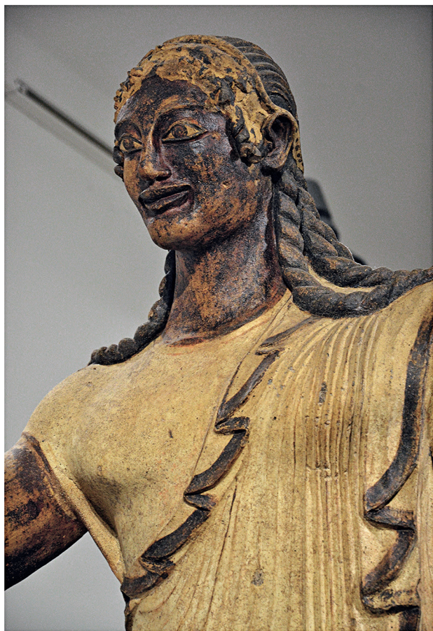
Аполлон из Вей. Ок. 550–520 гг. до н.э. Национальный музей этрусского искусства, Рим.