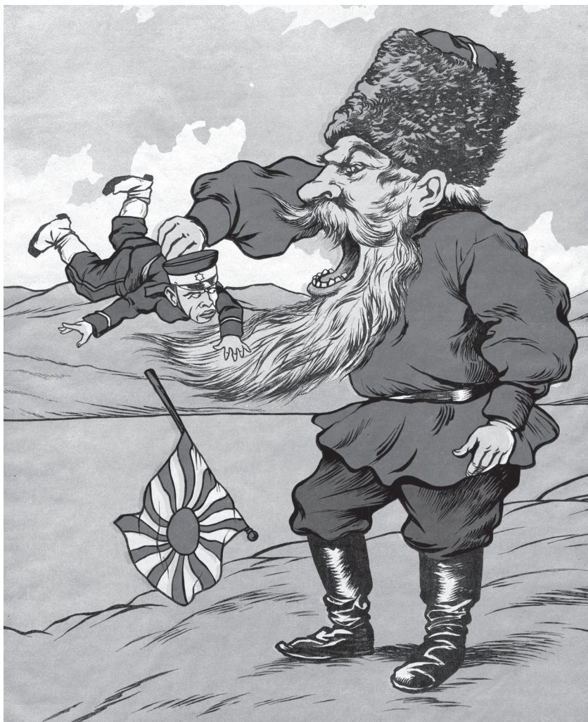
Милитаристский плакат времен русско-японской войны

что стоил бы выкуп всех негров юга). Все знают, не могут не знать главного, что войны, вызывая в людях самые низкие, животные страсти, развращают, озверяют людей. Все знают неубедительность доводов, приводимых в пользу войн, в роде тех, которые приводил Де-Местр, Мольтке и другие,