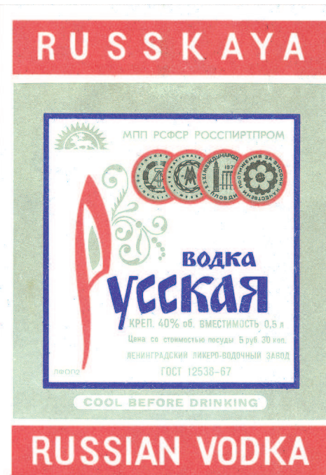
Новая водка отличается от старой ценой

Даже если будет восемь – Водку все равно не бросим. Передайте Ильичу: Нам и десять по плечу. Ну а если будет больше – Значит, сделаем, как в Польше. Ну а если двадцать пять – Снова Зимний будем брать.