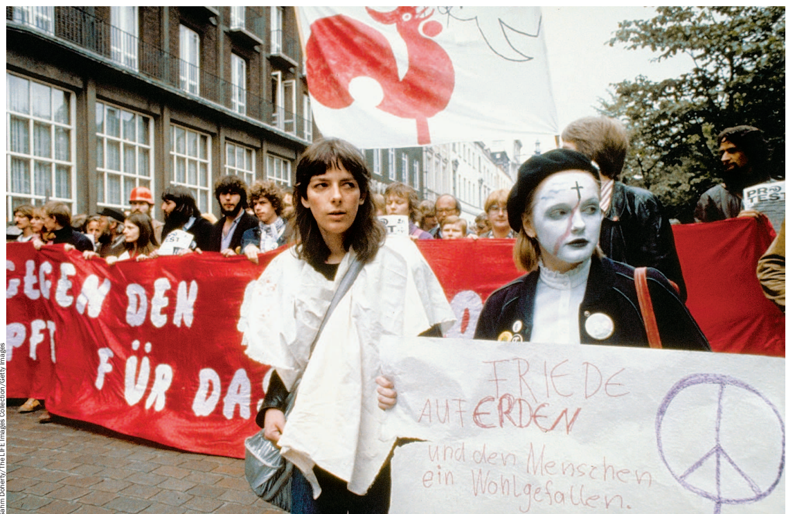
Демонстрация противников ракет средней дальности в ФРГ

Негласно отменена монополия социалистического реализма. Современное концептуальное искусство вроде Уорхола и Раушенберга как не понимали, так и не понимают, но ругают меньше, а авангард старый, со знаменитыми именами – официально разрешенная фронда. Дягилевские «Русские сезоны» признаны триумфом отечественного балета; их традицию достойно продолжают Большой и Кировский. Корешки двухтомного каталога выставки украшают книжные полки, на фоне которых позирует фотографам советская творческая элита.