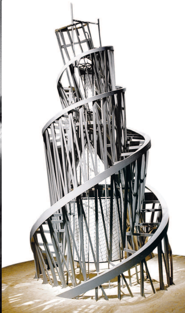
Татлин. Башня Третьего интернационала

частью европейской. В умозаключениях можно пойти еще дальше: а потом перестало, и написанные тогда картины про передовиков и съезды на какой совместной выставке покажешь – с Пекином, с Пхеньяном (см. «Москва – Берлин», 1996)? Франция – единственный Запад, духовное родство с которым можно признать после десятилетий особых политических отношений, «взаимовыгодного сотрудничества», кинодекад и проч. (см. в том числе «Де Голль в СССР», 1966; «Французские духи», 1975; «Французский космонавт», 1982). Импрессионисты и их преемники из коллекций Шукина и Морозова уже стали советской музейной гордостью. У Пикассо и Матисса больше не находят и следов буржуазного декаданта. Шагал – великий художник двух стран, и третьего тут не дано. Самых проблемных своих – Малевича, Кандинского, Татлина, Филонова – реабилитируют, называя «революционерами искусства». Прежде так оправдывали раннего Маяковского-футуриста.