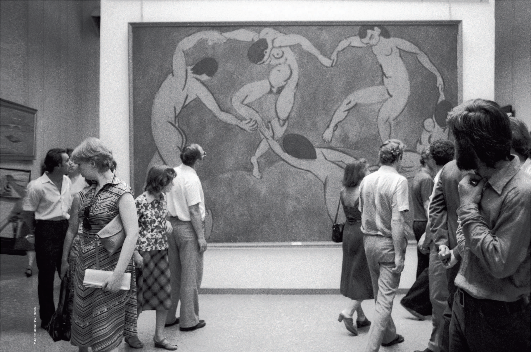
«Танец» Анри Матисса (коллекция Сергея Щукина), привезенный на выставку из Эрмитажа