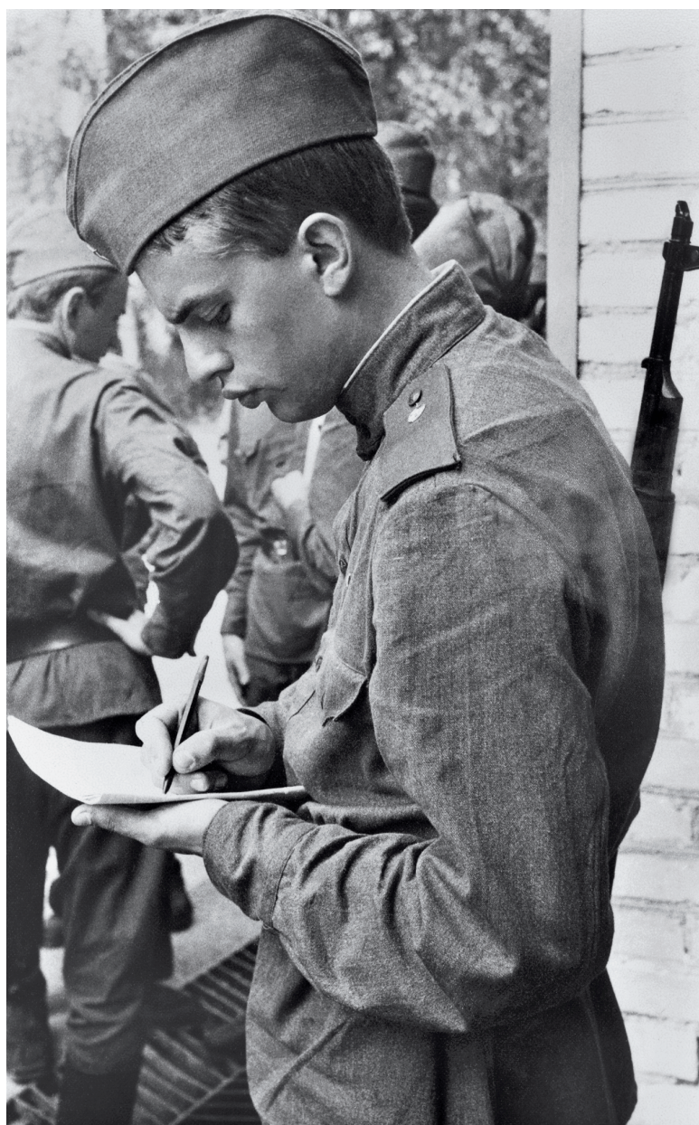
Автор, Ленинградский военный округ, Намедни-1981