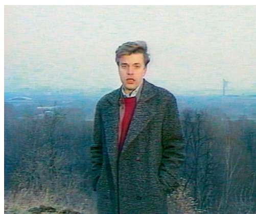
Автор, Центральное телевидение, Намедни-1988