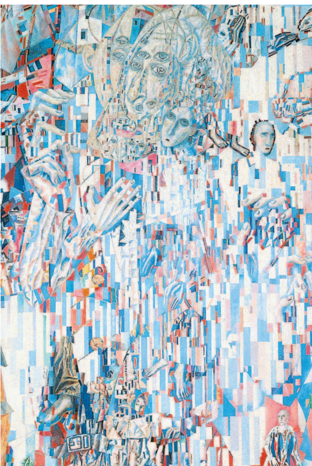
Арт-интервью / Санкт-Петербург / Emt News

3 июня в Музее изобразительных искусств имени Пушкина открывается грандиозная выставка «Москва – Париж», ранее показанная в Центре имени Помпиду под названием «Париж – Москва». СССР – последняя страна мирового авангарда, которая признает его классикой XX века