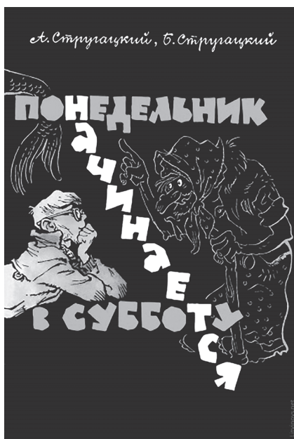
Обложка первого издания. 1965 г.

Для братьев Стругацких это в самом деле было счастливое время — от публикации первых повестей и рассказов они перешли к написанию и выпуску отдельных книг, которые без особого труда добирались до типографии и находили свой путь к восторженному читателю, не избалованному настоящей современной литературой.