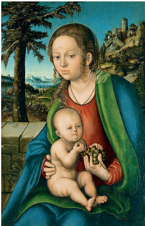
Лукас Кранах Старший. Мадонна с младенцем и виноградной гроздью. 1510