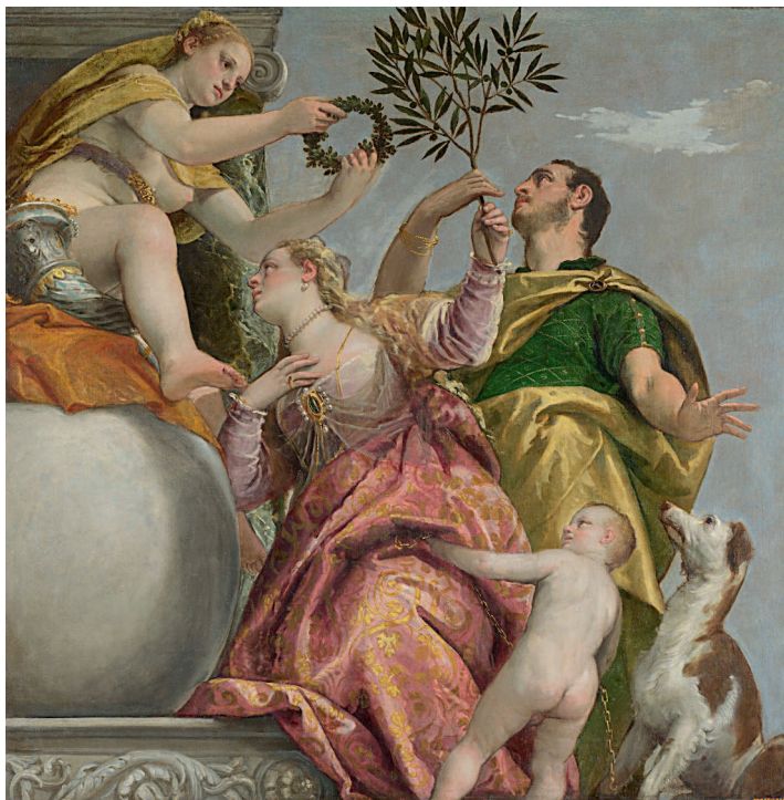
Паоло Веронезе. Аллегория любви. Счастливый союз. Серия из четырёх картин. Ок.1570