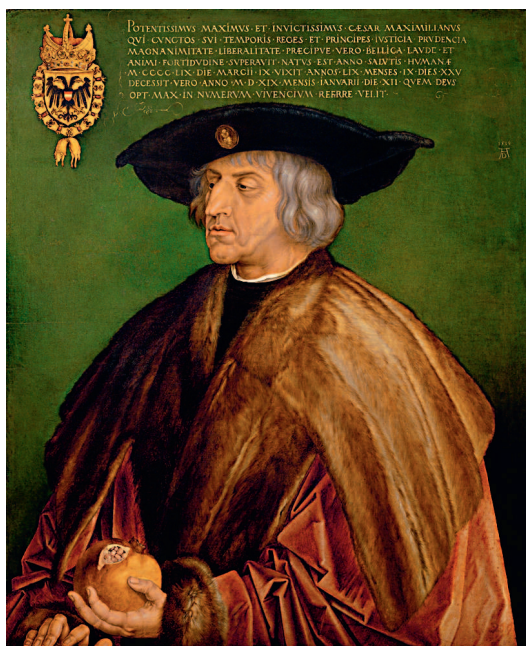
Альбрехт Дюрер. Портрет императора Максимилиана I. 1519

С глубокой древности гранат служил символом власти за счет своей формы — шара, увенчанного своеобразной короной. С плодом граната в руке на картине кисти Альбрехта Дюрера представлен император Максимилиан I, но и здесь гранат — это не только символ власти, но и символ объединения земель и народов под властью данного правителя — Священной Римской империи.