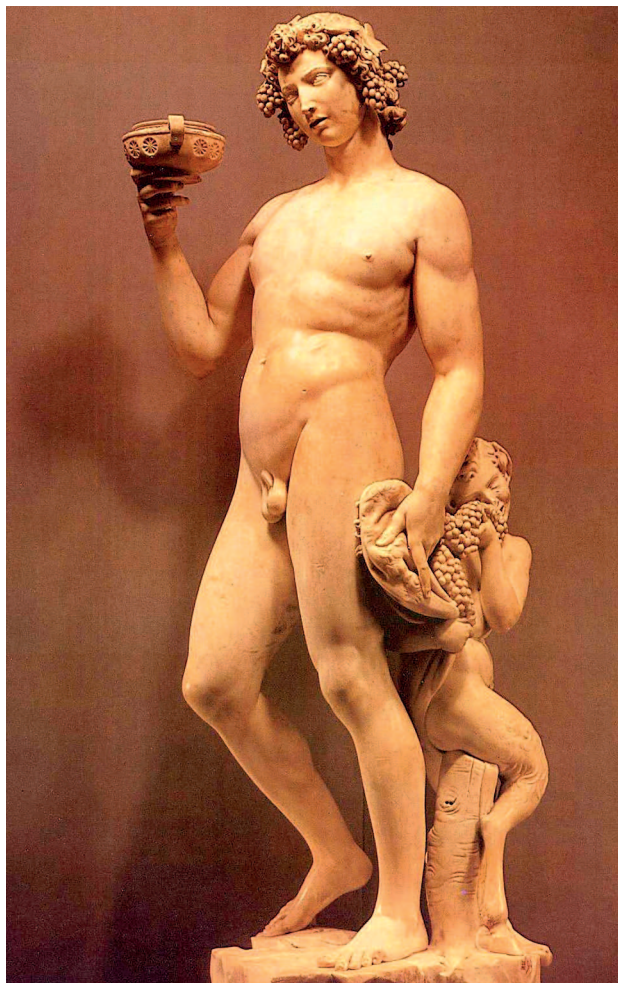
Микеланджело. Вакх. 1496–1497