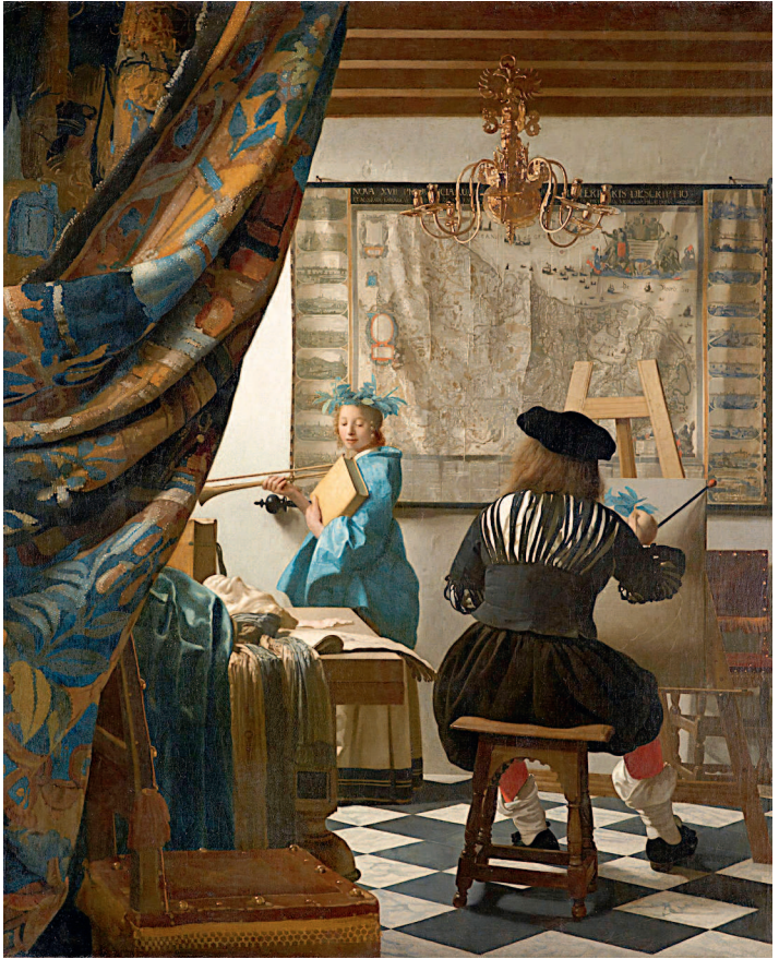
Ян Вермеер. Аллегория живописи. 1665–1667