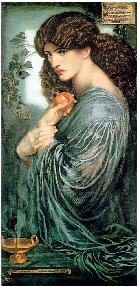
Данте Габриэль Россетти. Прозерпина. 1874