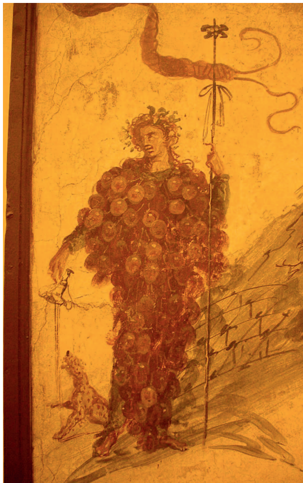
Бог Дионис в виде виноградной кисти. Помпеи. I в.