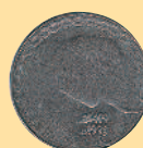
5 динаров, 1998 г.