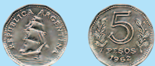
5 песо, 1962 г.