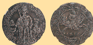
1 гульдинер, 1486 г.

В 1946—1950 гг. в обращение была введена серия монет из цинка, медно-алюминиевого и медно-никелевого сплавов с гербом республики на аверсе и указанием номинала на реверсе. В период 1950—2001 гг. чеканились монеты с различными графическими рисунками на аверсах: 1 шиллинг с национальным символом Австрии — альпийским эдельвейсом, 5 шиллингов с всадником на лошади и 10 шиллингов с изображением девушки в национальном праздничном чепчике с золотой филигранью.