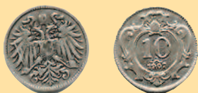
10 геллеров, 1907 г.