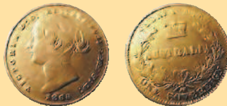
1 соверен, 1866 г.