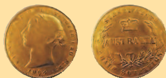
1/2 соверена, 1866 г.

В 1966 г. Австралия перешла на десятичную денежную систему, а государственной валютой стал австралийский доллар, равный 100 центам. С июля 1967 г. начался выпуск первых десятичных монет достоинством 1 и 2 (бронзовые), 5, 10, 20 и 50 (медно-никелевые) центов. 1 цент приравнивался к 1 пенни, а 10 центов — к старому шиллингу. На аверсе монет этой серии размещен портрет королевы Елизаветы II, а на реверсе — уникальные животные Австралии. Монета 1 доллар была выпущена в 1984 г., 2 доллара — в 1991 г. На аверсе этих монет изображение Елизаветы II, на реверсе — группа кенгуру (1 доллар) и австралийский абориген (2 доллара). В 1991 г. монеты достоинством 1 и 2 цента были выведены из обращения.