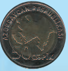
50 гяиков, 2006 г.