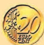
20 евроцентов, 2002 г.