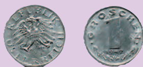
1 грош, 1947 г.