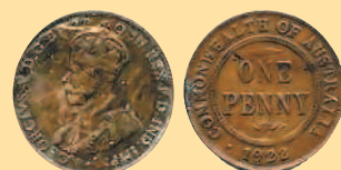
1 пенни, 1922 г.