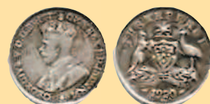
3 пенса, 1929 г.