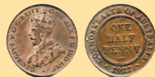
1/2 пенни, 1927 г.