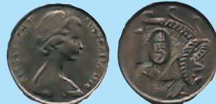
10 центов, 1966—1984 гг.