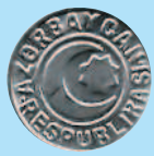
20 гяиков, 1993 г.