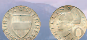
10 шиллингов, 1965 г.