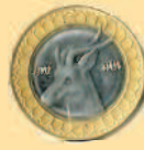
50 динаров, 1999 г.