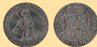
1 талер, 1564—1595 гг.