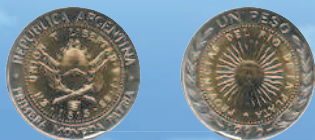
1 песо, 1995 г.