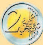
2 евро, 2002 г.