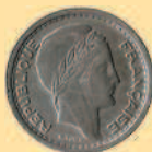
20 франков, 1949 г.

В 1992 г. был введен новый ряд монет, состоящий из 1/4, 1/2, 1, 2, 5, 10, 20, 50 и 100 динаров. Монеты 1/4 и 1/2 динара вскоре выбыли из обращения. В настоящее время в обращении находятся монеты номиналом 5, 10, 20, 50 и 100 динаров с изображениями животных на аверсе и указанием номинала в обрамлении звезд на реверсе. На реверсе 100 динаров помещен стилизованный номинал, обрамленный арабской вязью.