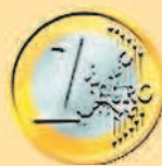
1 евро, 2002 г.