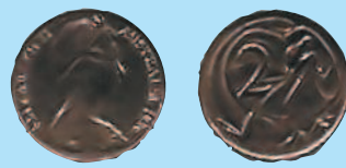
2 цента, 1966—1984 гг.