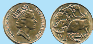
1 доллар, 1985 г.