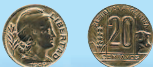
20 сентаво, 1949 г.