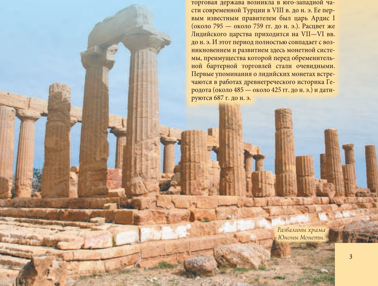
Развалины храма Юноны Монеты.

Однако идея использования обработанных кусков металла с вычеканенным изображением в качестве платежных средств принадлежит отнюдь не древним римлянам. Она родилась более чем за 4 столетия до появления монетного двора в Риме в небольшом, но экономически развитом тогда государстве Малой Азии — Лидии. Эта торговая держава возникла в юго-западной части современной Турции в VIII в. до н. э. Ее первым известным правителем был царь Ардис I (около 795 — около 759 гг. до н. э.). Расцвет же Лидийского царства приходится на VII—VI вв. до н. э. И этот период полностью совпадает с возникновением и развитием здесь монетной системы, преимущества которой перед обременительной бартерной торговлей стали очевидными. Первые упоминания о лидийских монетах встречаются в работах древнегреческого историка Геродота (около 485 — около 425 гг. до н. э.) и датируются 687 г. до н. э.