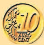
10 евроцентов, 2002 г.