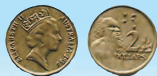
2 доллара, 1986 г.