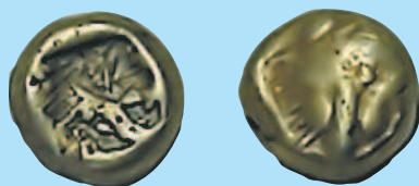
1/3 статера Лидии царя Ардиса II, 644—629 г. до н. э.

Лидийские статеры использовались не только как платежное средство. Их активно подносили различным божествам во время религиозных церемоний. Даже цари щедро задабривали своих богов, отдавая огромные суммы храмам. После получения щедрых даров местные жрецы-оракулы делали предсказания (от имени богов, разумеется), определяя судьбу государства. Однако даже боги не спасли Лидию от краха. Царь Крез, готовясь к войне с персидским правителем Киром Великим, пожелал услышать предсказание о предстоящих баталиях. Оракул дал двусмысленный ответ: «Если царь переступит через реку, то он разрушит великое царство». Крез подумал, что раз лидийцы снабжают монетами богов, то в руинах окажется Персидское царство. И прогадал. В 546 г. персы разгромили лидийские войска, Лидия как государство была уничтожена навсегда. А Кир Великий захватил лидийские монетные дворы и получил самую совершенную на тот момент технологию изготовления монет, которая быстро распространилась на территории Персии, Греции, Карфагена и других античных государств. Также в VI в. до н. э. были созданы собственные технологии изготовления монет в Китае и Индии.