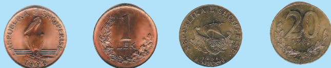
1 лек, 1996 г.