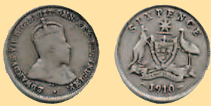
6 пенсов, 1910 г.