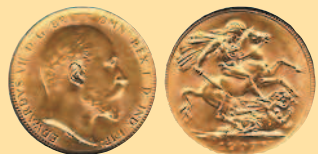
1 соверен, 1910 г.