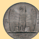
2 франка, 1927 г.