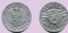
50 грошей, 1947 г.