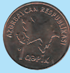
1 гяик, 2006 г.