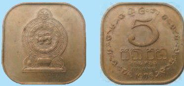
Монета в форме квадрата с закругленными краями: 5 центов Шри-Ланки, 1975 г.