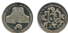
10 леков, 2005 г. Посвящена албанскому народному костюму.