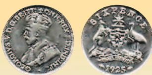
6 пенсов, 1925 г.