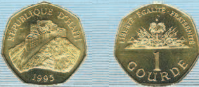
Многоугольная монета: 1 гурд Гаити, 1995 г.