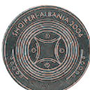
50 леков, 2004 г. Посвящена албанскому городу Дуррес.