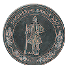
50 леков, 2004 г. Посвящена албанской государственности.