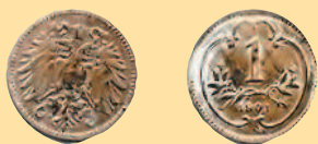
1 геллер, 1901 г.