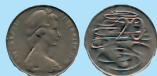
20 центов, 1966—1984 гг.