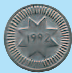
10 гяиков, 1992 г.