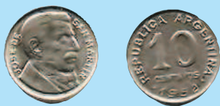
10 сентаво, 1952 г.

Аргентинская Республика ( República Argentina ) — государство в Южной Америке. Официальная денежная единица — аргентинское песо, равное 100 сентаво.