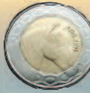
100 динаров, 1993 г.