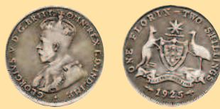
1 флорин, 1925 г.