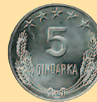
5 киндарок, 1964 г.