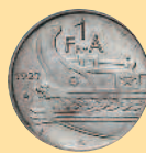
1 франк, 1927 г.