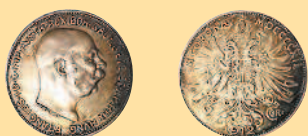
2 кроны, 1912 г.