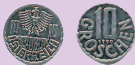
10 грошей, 1990 г.