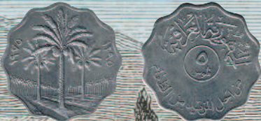
Монеты с волнистым краем: 5 филсов Ирака, 1975 г.

Начиная с XIX в. монеты постепенно перестают выступать в качестве основного платежного средства, уступая более дешевым в производстве и удобным в обращении банкнотам. В наше время существуют государства, в оборотах которых находятся исключительно бумажные либо пластиковые деньги. И все же в большинстве стран мира продолжается чеканка полноценных, разменных (дробных), памятных (юбилейных), коллекционных, а также инвестиционных монет. Полноценные и разменные монеты изготавливаются из недорогих металлов и сплавов: латуни, меди, никеля, алюминия, мельхиора, алюминиевой бронзы и других. А вот памятные, коллекционные и инвестиционные монеты чеканят в основном из благородных металлов: золота, серебра, палладия, платины.