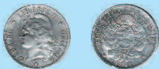
1 песо, 1881 г.