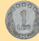
1 лек, 1964 г.