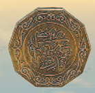
5 динаров, 1981 г.