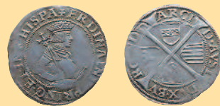
6 крейцеров, 1522—1530 гг.