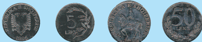
5 леков, 1995 г.