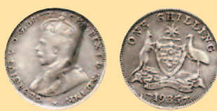
1 шиллинг, 1935 г.