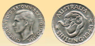
1 флорин, 1943 г.