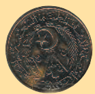
50 сантимов, 1964 г.