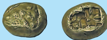
1 статер из электро царя Ардиса II, 644—629 г. до н. э.