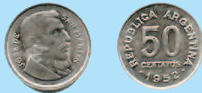
50 сентаво, 1952 г.