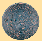
1 сантим, 1964 г.