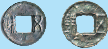
Монета с квадратным отверстием: 1 шу Китая, III в.