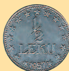
1/2 лека, 1957 г.