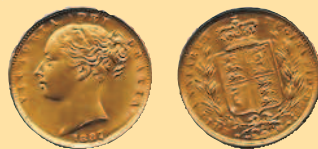
1 соверен, 1887 г.