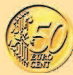
50 евроцентов, 2002 г.