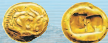
Золотой статер царя Креза, 560—546 до н. э. Аверс: головы льва и быка. Реверс: 2 прямоугольника.