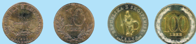
10 леков, 1996 г.