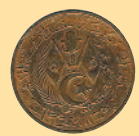
10 сантимов, 1964 г.