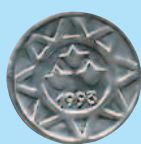
5 гяиков, 1993 г.

Азербайджанская Республика ( Azərbaycan Respublikası ) — государство в Передней Азии, в Закавказье. Официальная денежная единица — азербайджанский манат, равный 100 гятикам.