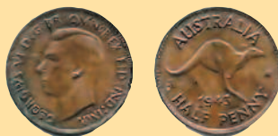
1/2 пенни, 1945 г.