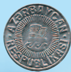
50 гяиков, 1993 г.