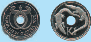
Монета с круглым отверстием: 1 кина Папуа и Новой Гвинеи, 1975 г.