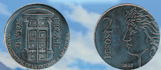
2 песо, 2010 г.

1 августа 1776 г. образовалось испанское вице-королевство Рио-де-ла-Плата, включившее в себя территории современных Аргентины, Уругвая, Парагвая и Боливии. В 1816 г. в результате борьбы против Испании Аргентине удалось добиться независимости, и в 1826 г. была провозглашена Федеративная Республика Аргентина. Каждая ее провинция имела право на чеканку собственной монеты. В 1875 г. введена десятичная монетная система, но выпуск первых монет новой серии состоялся только в 1881 г. Ранние аргентинские монеты, как, впрочем, и современные, назывались песо и состояли из 100 сентаво. На аверсе этих монет чаще всего изображалась женщина во фригийском колпаке (символ свободы), на реверсе — герб или указание номинала. В 1950—1980-е гг. выпускались монеты с портретом национального героя Аргентины Хосе де Сан Мартина (1778—1850 гг.), изображением фрегата «Президент Сармьенто», гаучо (эквивалент североамериканского слова «ковбой») и символом бога инков — Инти («Майское солнце») на аверсе.