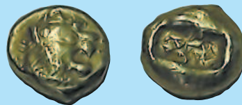
1 лидийский статер царя Алиатта, 610—560 г. до н. э. Аверс: голова льва. Реверс: 2 прямоугольника.