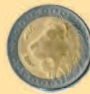
20 динаров, 1992 г.