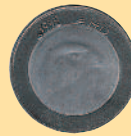
10 динаров, 1992 г.