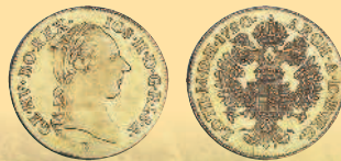
1 дукат, 1790 г.