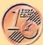
1 евроцент, 2002 г.