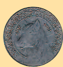
1/2 динара, 1992 г.