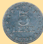
5 леков, 1957 г.