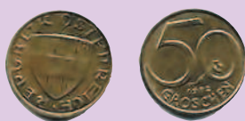
50 грошей, 1992 г.