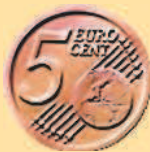
5 евроцентов, 2002 г.