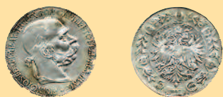
5 крон, 1907 г.