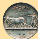
5 франков, 1926 г.