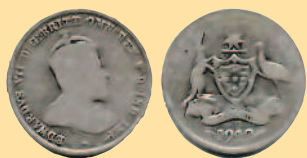
1 шиллинг, 1910 г.