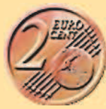
2 евроцента, 2002 г.