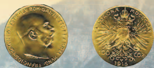
100 крон, 1915 г.