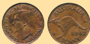
1 пенни, 1942 г.