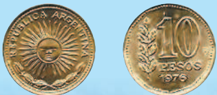
10 песо, 1976 г.