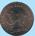
5 гяиков, 2006 г.