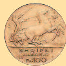
100 франков, 1926 г.