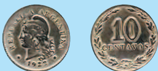
10 сентаво, 1922 г.