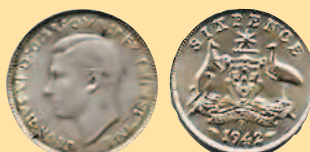
6 пенсов, 1942 г.