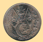
1 динар, 1964 г.