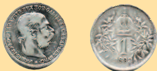
1 крона, 1892 г.