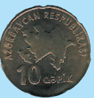
10 гяиков, 2006 г.