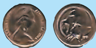
1 цент, 1966—1984 гг.