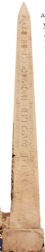
Обелиск и гномон в Карнакском храме в Луксоре, Египет