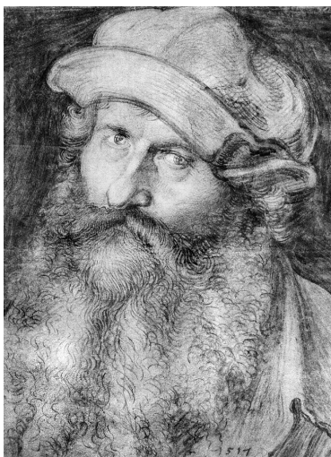
Иоганн Стабий. Портрет работы Альбрехта Дюрера

Эпоха печатных звездных карт началась в 1515 г., с появлением первого издания северной и южной карт неба, выполненных по каталогу Птолемея. Авторами этого труда были инициатор издания карт, астроном, профессор математики Венского университета Иоганн Стабий (1460–1522), нюрнбергский астролог и астроном Конрад Хейнфогель (ум. 1517) и немецкий живописец и график, величайший мастер гравюры Альбрехт Дюрер (1471–1528). Впоследствии изображения отдельных участков звездного