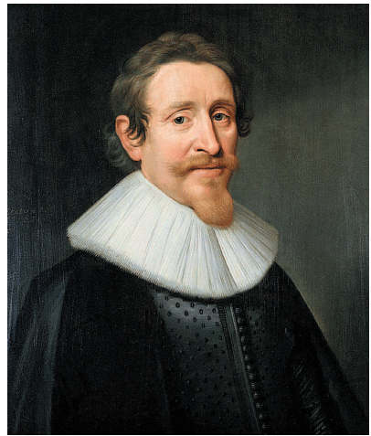
Гуго Гроций. Портрет работы Михиля ван Миревельта. 1631 г.

Основное внимание в таких атласах уделялось графическому изображению «звездных фигур» и их мифологических прототипов, в то время как изображения звезд были чисто декоративными. Например, местоположение астрономических объектов на звездной карте в таких атласах менялось ради красивого рисунка. В результате точность нанесения созвездий на сетку небесных координат не достигала даже точности словесного описания звездного неба в работах античных астрономов, поэтому многие из первых публикаций звездных атласов нельзя отнести к астрономическим работам.