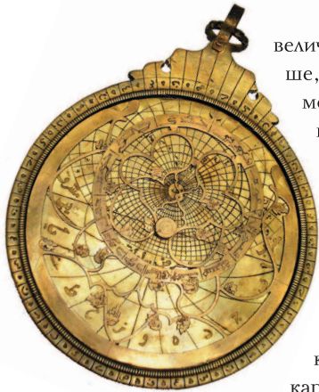
Старинная астролябия. Персия

величины астрономического объекта (чем она больше, тем больше диаметр кружка). А чтобы звезды можно было отыскать на карте по их координатам, карта снабжается координатной сеткой.