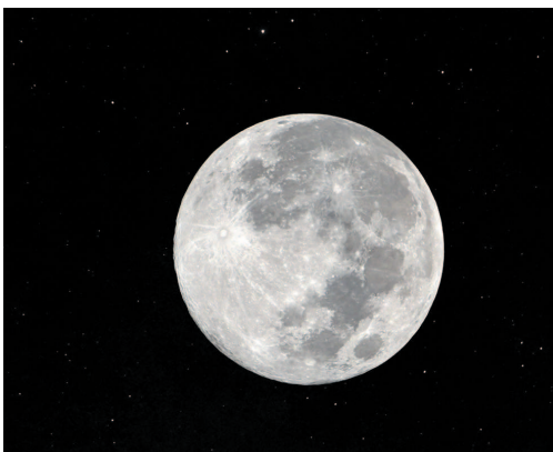
Полная Луна мешает наблюдению за звездами невооруженным глазом

Звездная величина — это безразмерная числовая характеристика яркости небесного тела, которая обозначается буквой m (так, как мы обозначаем степень числа). С развитием астрономии и с появлением оптических приборов были введены дробные, нулевые, а для самых ярких астрономических объектов и отрицательные звездные величины. Так, яркость Луны в полнолуние равна -12,7^m . Солнце примерно в 400 000 раз ярче полной Луны, его видимая звездная величина составляет -26,7^m . Звездная величина самой яркой из звезд, Сириуса, близка к -1,5^m , а звездные величины самых слабых объектов, снятых 8-метровым наземным телескопом и космическим телескопом «Хаббл» равны соответственно +27^m и +31,5^m .