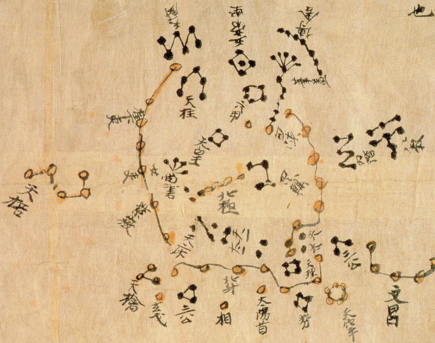
Деталь китайской звездной карты из Дуньхуана, пока- зывающая небо северных широт. Династия Тан. Ок. 700 г.