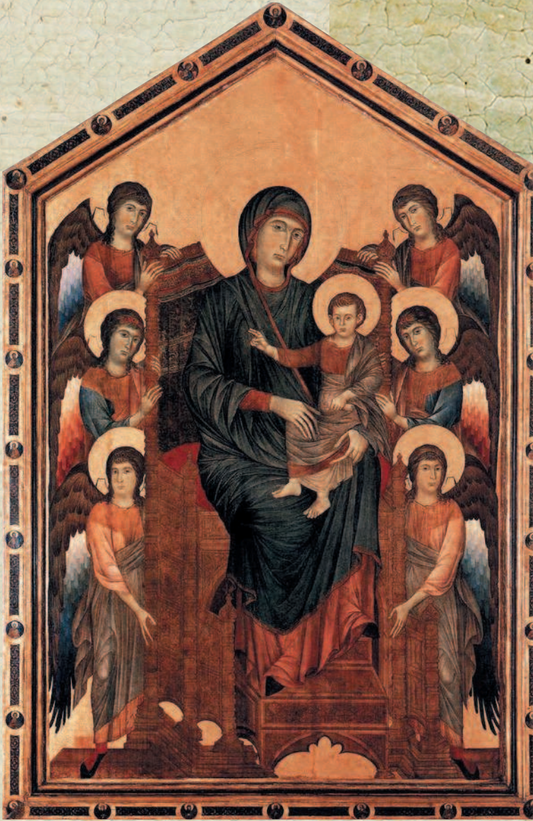
Чимабуэ. Мадонна на троне в окружении шести ангелов (1280). Лувр, Париж.