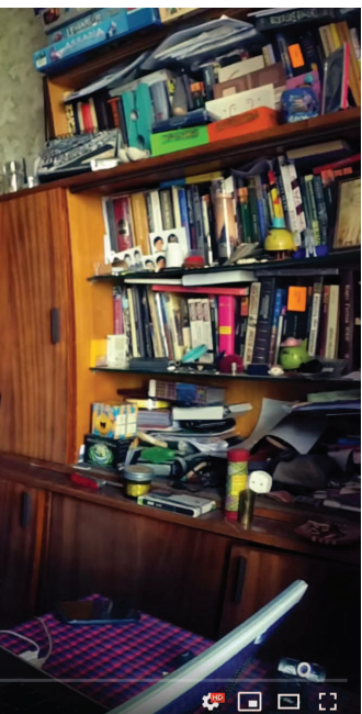
Это кадр из клипа, который я снимал в те времена. Поищите Anton Maskeliade \\\ Morning Sessions #2