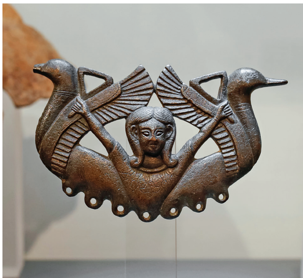
Рис. 5. Бронз К рри со. VII–VI вв. до н.э. Археологический музей Севильи, Испания

Интересно, что места обнаружения тартесийских кладов некогда были сожжены, что наводит на размышления о внезапном исчезновении этой цивилизации в VI веке до нашей эры. Вероятнее всего, это случилось в результате греко-карфагенских сражений. Именно Карфаген будет властвовать на иберийском побережье, пока сам не столкнется с новым противником — Римской империей.