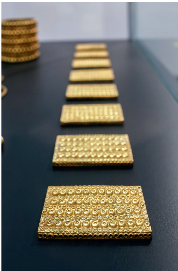
Рис. 3. Кл д из К р мболо. VII–VI вв. до н.э. Археологический музей Севильи, Испания