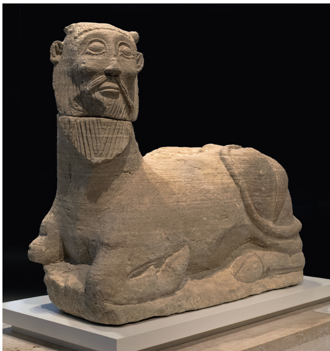
Рис. 6. Бюст из К с с-дель-Турунуэло (Б д хос). VIII–IV вв. до н.э.

© Ángel M. Felicísimo / Flickr.com по лицензии (CC BY 2.0) https://creativecommons.org/licenses/by/2.0/legalcode