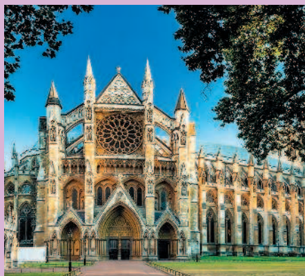
Вестминстерское аббатство — готическая церковь в Лондоне

Страны Западной Европы богаты архитектурными шедеврами самых разных стилей и эпох. Прикоснуться к загадочным мегалитическим постройкам можно в Великобритании, посетив Стоунхендж. А изучать готическую архитектуру лучше всего в Германии. Окунуться в средневековья помогут великолепные замки на берегу реки Луары во Франции. И, конечно, непременно нужно взглянуть на стройную красавицу Парижа — Эйфелеву башню.