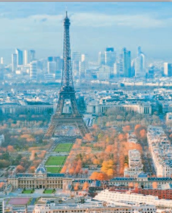
Эйфелева башня — самая узнаваемая достопримечательность Парижа

З ападная Европа — это один из самых развитых экономических регионов планеты. В его составе самое крупное европейское государство — Франция, и одна из карликовых стран — Монако. История стран Западной Европы сохранила немало событий, оставивших след в мировом культурном наследии. Максимум свободы также можно почувствовать в одной из стран этого региона, ведь в Нидерландах позволено практически все.