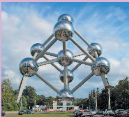
Атомium — одна из главных достопримечательностей и символ Брюсселя

Западная Европа до сих пор хранит в себе дух «Старого света», который ярче всего проявляется в ее многочисленных старинных городах. Ежегодно миллионы туристов приезжают прогуляться по улицам крупных мегаполисов, таких как Париж, Лондон и Берлин. Любителям же уютных маленьких городов наверняка приглянутся Люксембург, Вадуц и Монако. А вкус роскоши всегда можно почувствовать в Вене или Женеве.