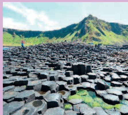
Дорога гигантов в Ирландии — памятник природы, объект Всемирного наследия ЮНЕСКО

Мест, куда не ступала нога человека, в Западной, да и во всей остальной Европе гораздо меньше, чем в других частях света. Поэтому каждое сохранившееся чудо природы еще больше привлекает туристов своей первозданной красотой и возможностью отдохнуть от городской суеты. Дорога гигантов и Монблан, Ваттовое море и ледник Алетч — загадочный мир природы зовет в незабываемое путешествие по просторам стран Западной Европы.