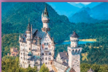
Нойшванштайн — романтический замок Людвига II в юго-западной Баварии

З ападная Европа — это один из самых развитых экономических регионов планеты. В его составе самое крупное европейское государство — Франция, и одна из карликовых стран — Монако. История стран Западной Европы сохранила немало событий, оставивших след в мировом культурном наследии. Максимум свободы также можно почувствовать в одной из стран этого региона, ведь в Нидерландах позволено практически все.