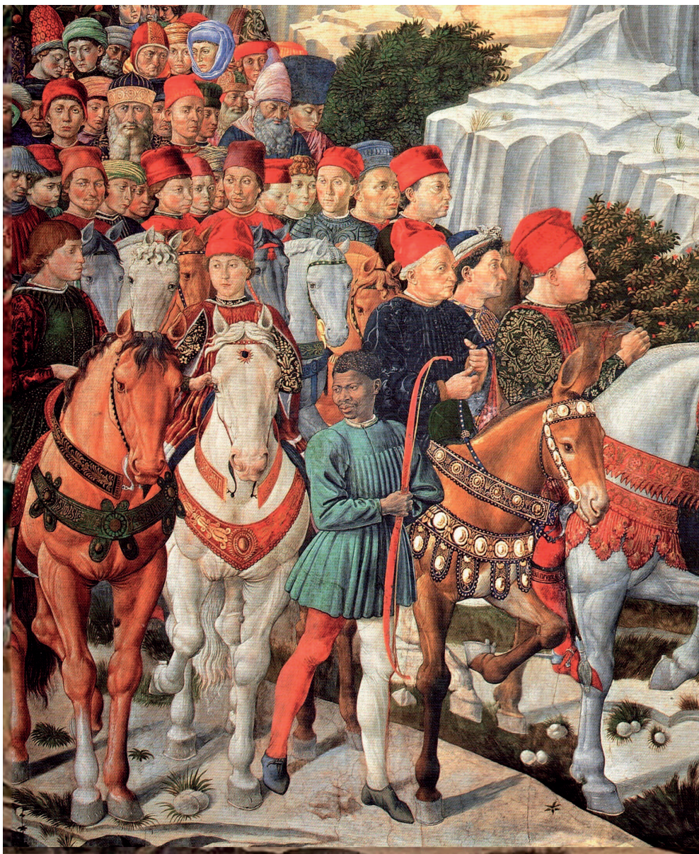
Справа. Беноччо Гоццолли. Шествие волхвов в Вифлеем. Фрагмент. 1459–1462. Палаццо Медичи-Рикарди, Флоренция