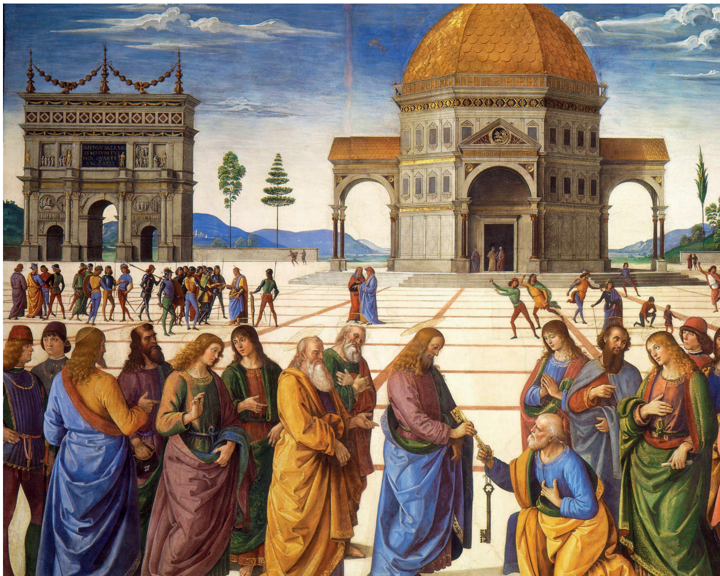
Пьетро Перуджино. Вручение ключей апостолу Петру. 1480–1482. Сикстинская капелла, Ватикан