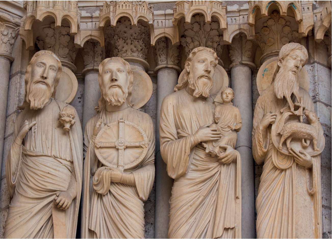
Вверху. Скульптурное убранство северного портала собора в Шартре

Слева. Кёльнский собор, который строили и перестраивали в общей сложности на протяжении нескольких столетий, — один из главных архитектурных символов готического стиля