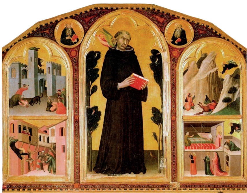
Симоне Мартини. Алтарь Блаженного Агостино Новелло. 1324. Сиенская пинакотека. Мартини — выдающийся живописец времен Проторенессанса