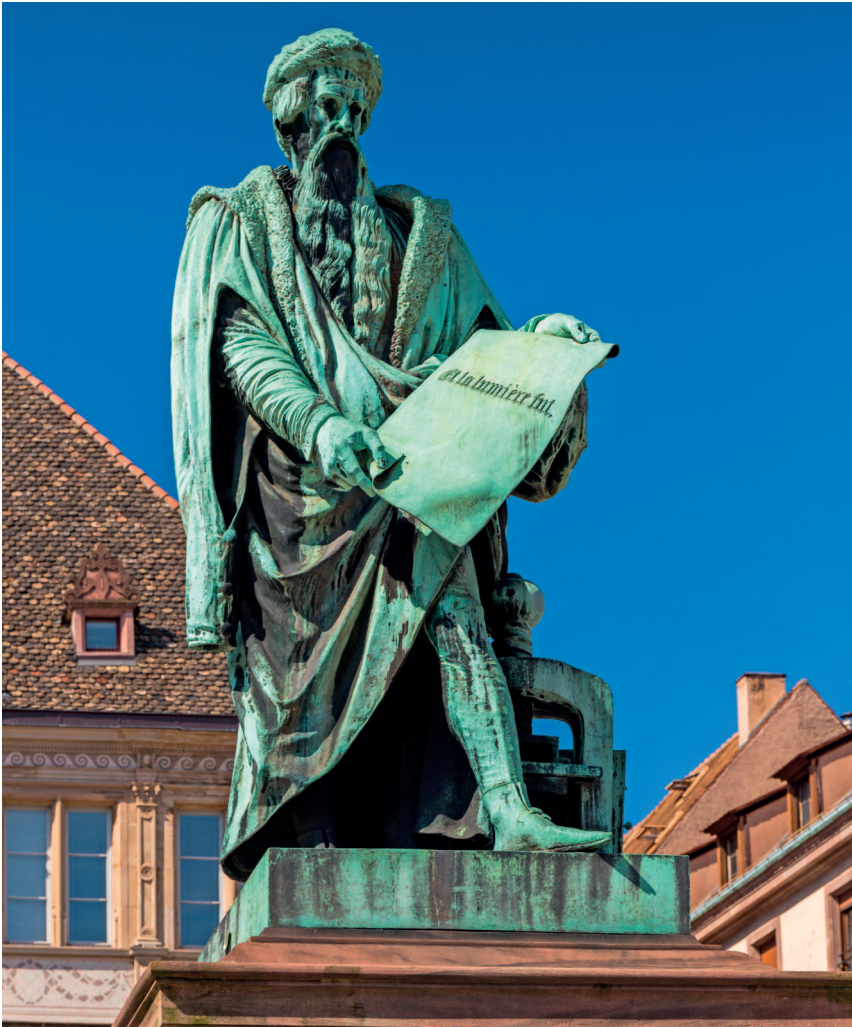
Давид д'Анже. Памятник Иоганну Гутенбергу в Страсбурге. 1840

Огромное значение имел научный и технологический прорыв. Развитие математики, астрономии и анатомии заложило основы научного метода познания. Изобретение книгопечатания Иоганном Гутенбергом в середине XV века совершило революцию в распространении знаний, сделав книги более доступными и подорвав монополию церкви на образование.