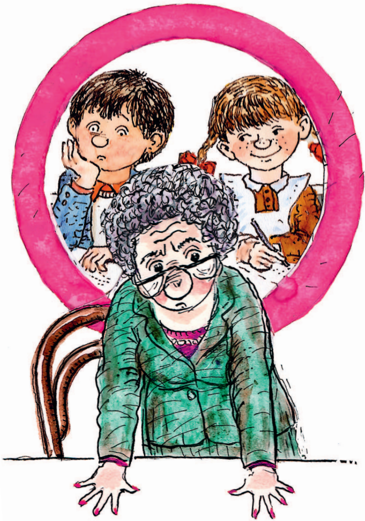
Рисунки Н. Беланова