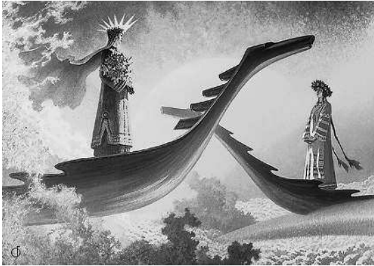
Аврора на картине художника Б. Ольшанского «У небесного причала»

АВСЕНЬ м. — первый день весны, 1 марта, коим прежде начинался год; ныне название это перенесено на Новый год и на Васильев вечер, канун Нового года. В песнях: тусень, титусень, туа-сень, таусель; щедрованье или обсев хозяина житом, с пожеланьями; свиная голова к обеду; вечером гаданья.