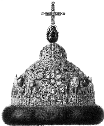
Ф. Солнцев. Алмазная шапка царя Петра Алексеевича

АЛМАЗ м. — первый по блеску, твердости и ценности из дорогих (честных) камней; алма́нт, бриллиант. Алмаз, чистый углерод в гранках (кристаллах), сгорает без остатка, образуя угольную кислоту. Алмаз название общее; бриллиант — более ценный по величине и полной грани; алмаз неполной грани, плоский — бывает в глухой (с исподу) оправе; розетка, искра — самый мелкий алмаз. Алмаз стекольщик — неграненый, сырой, в оправе на ребро, на природную грань. Свой глаз алмаз — свой призор. Алмаз алмазом режется, вор вором губится — в сыщики берут такого же вора. Алмаз ангельская слеза — поверье.