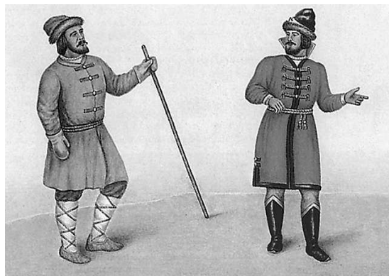
Азям и кафтан

АЗБУКА ж. — алфавит, абевега, стар. букваца; собрание в порядке всех письмен, букв, какой-либо грамоты; азбука славянская — собственно букваца, кириллица, для отличия от глаголицы, вероятно, придуманной папистами; || учебник грамоты, букварь; || начальные основания какой-либо науки. Азбуку учат, во всю избу кричат. || Роспись, оглавление, указатель в азбучном порядке, алфавит. Азбука имен. Азбучник м. -ница ж. — учебник азбуки, начал грамоты. Азбукóвина ж. — чужие, нерусские, незнакомые письмена; уродливые, ломаные.