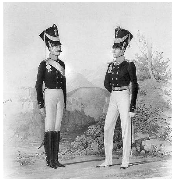
Амуниция офицера и рядового Кабардинского пехотного полка на картине неизвестного худ.

А́НГЕЛ м. — существо духовное, одаренное разумом и волею. Ангел Велика Совета — Спаситель. Ангел-хранитель — приставленный Господом к человеку, для охраны его. Ангел света — благой, добрый; ангел тьмы — аггел, злой дух. Чей-либо ангел — святой, коего имя кто носит; день ангела — именины. По злоупотреблению ангелом и ангелом во плоти называ-