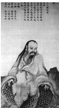
Фу Си, легендарный первый император Китая

Инь и ян — важнейшая категория древней китайской философии, отражающая двойственность этого мира. Пять элементов, возникающих в результате взаимодействия инь и ян, создают все материальное многообразие Вселенной.